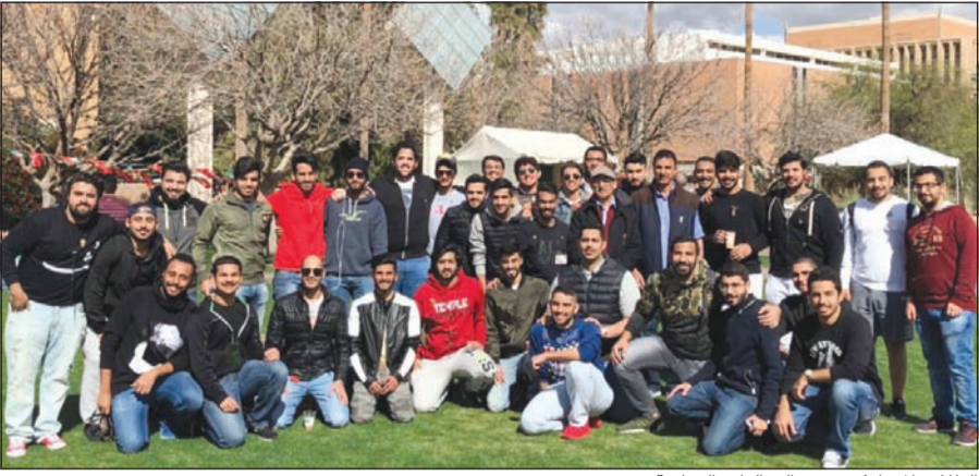
الطلاب المشاركون في الفعاليات الوطنية