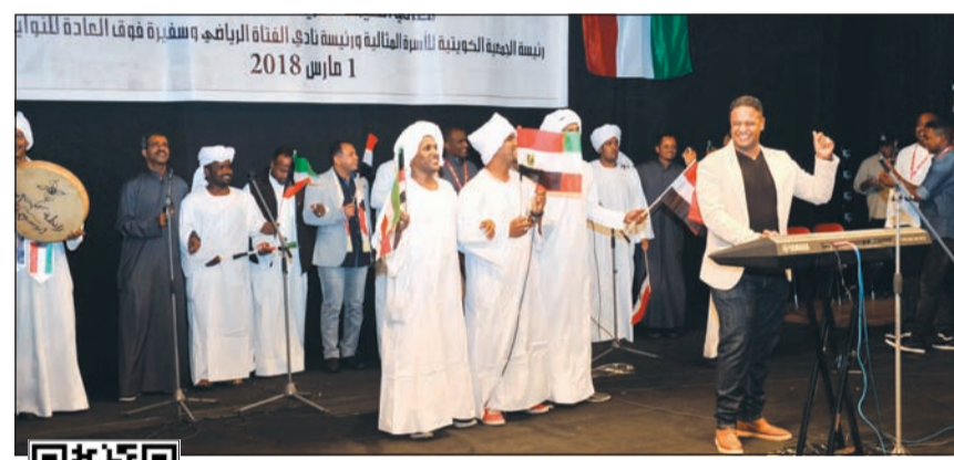
فقرة من الفرقة النوبية