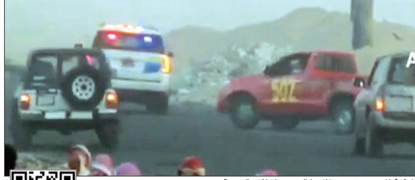
المركبة المستهتره تعمد قائدها الرجوع لإتلاف الدورية