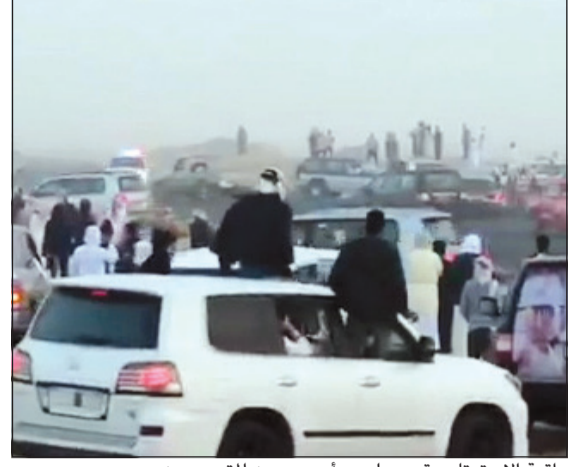
واقعة الاستهترار وقعت على مرأى عدد من المتجمهرين