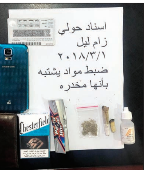
سجائر ملغومة وماريغوانا من قبل أمن حولي

3 معاطين إلى جانب تحرير 100 مخالفة مروية وإحالة 40 مركبة إلى كراج الحجز الى جانب ضبط 3 وافدين مخالفين لقانون الإقامة. وقال مصدر امني ان اغلب المخالفات المرورية التي حررت