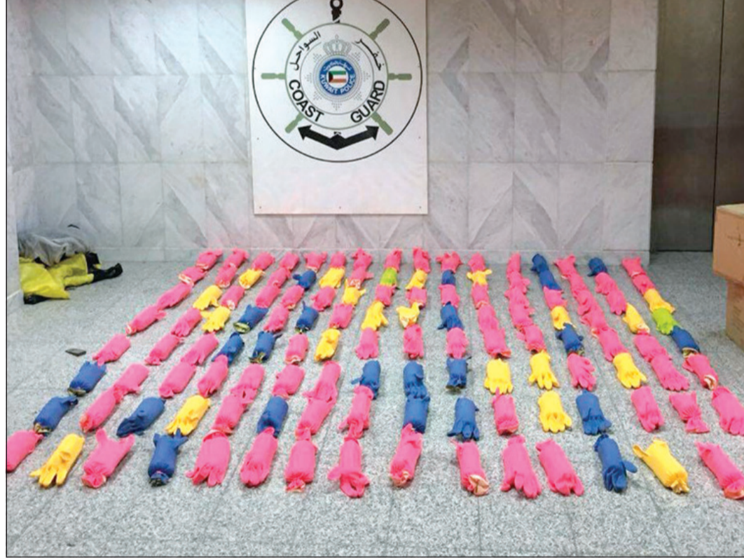
المخدرات المضبوطة من قبل «خفر السواحل» بلغت 128 كغافة حسب بيان «الداخلية»

ذكرت الإدارة العامة للعلاقات والإعلام الأمني بوزارة الداخلية أن دوريات الإدارة العامة لخفر السواحل تمكن من إحباط محاولة تهريب كمية من المواد المخدرة عن طريق البحر، حيث رصدت المنظومة الإدارية التابعة لخفر السواحل هدفاً قادماً من خارج المياه الإقليمية للكويت، وعلى الفور قامت الدوريات البحرية في القطاع الجنوبي للبلاد من اعتراض واستيقاف الزورق لدخوله المياه الإقليمية بطريقتة غير مشروعة. حيث كان على متن الزورق عدد 3 أشخاص من الجنسية الإيرانية وكان في حوزتهم عدد 128 قطعة من المواد المخدرة بقصد الاتجار، وتمت إحالة الأشخاص والكمية المضبوطة إلى جهة الاختصاص لاستكمال الإجراءات القانونية وعمل اللازم. وبحسب مصدر امني فإن المضبوطات تتجاوز الـ 100 كيلو غرام من مادة الحشيش. وتؤكد الإدارة العامة للعلاقات والإعلام الأمني أن الإدارة العامة لخفر السواحل بالرصد لأي محاولة للعبث بأمن البلاد ومنع التسلسل والتهريب غير المشروع.