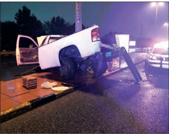
المركبة وقد تهشمت مقدمتها بالكامل بفعل الاصطدام

محمد الجلاهمة - عبدالله فنيص كُتبت النجاة لمواطن إثر تصادم عنيف وقع بين مركبة المواطن وعمود إنارة، وقال مصدر أمني إن بلاغاً بوقوع حادث في منطقة الرقة تلقته جنائية عمليات الداخلية، وبانتقال رجال الأمن تبين أن الحادث عبارة عن اصطدام مركبة بعمود إنارة، وأن المركبة تعرضت للانشطار في المقدمة، إلا أن قائدها أُسعف للعلاج من إصابة متوسطة في مستشفى العدان.