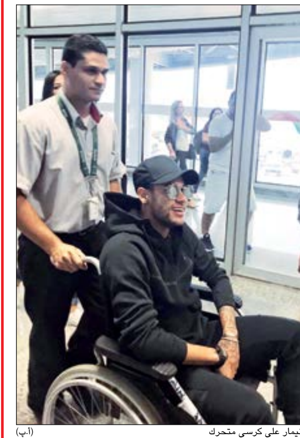
نيمار على كرسي متحرك (أ.ب)

وقد رحلت التقارير الصحافية البرازيلية ان تقام العملية في مدينة بيلو هوريزونتي (جنوب شرق)، وعلى الأغلب في مستشفى ماتر داي، حيث يعمل الطبيب الأسمر، والذي كان قد وصل الى باريس للوقوف على حالة نيمار، قاطعاً مشاركته في مؤتمر ينظمه الاتحاد الدولي (فيفا) في مدينة سوتشي الروسية للمنتخبات المتأهلة الى المونديال.