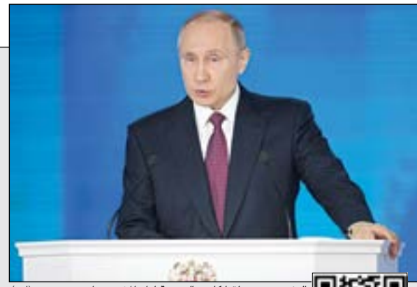
الرئيس بوثنين ملقيا كلمته السنوية أمام المشرعين أمس