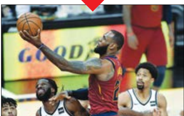
المعلق ليجرون (أب)

التقط كليفلاند كافاليرز وصيف البطل أنفاسه وحقق فوزاً مهما على ضيفه بروكلين نتس 129-123، وأصبح خلاله النجم ليجرون جيمس أكبر لاعب يحقق تريبل دبل ضمن دوري كرة السلة الأمريكي للمحترفين. ويدين كليفلاند بشكل كبير في هذا الفوز لنجمه «الملك» ليجرون جيمس الذي أصبح أكبر لاعب في البطولة يحقق تريبل دبل (10 على الأقل في ثلاث من الفئات الإحصائية الفردية الخمس: نقاط، متابعات، تمريرات حاسمة، سرقة الكرة أو صدها)، بتسجيله 31 نقطة مع 12 متابعة و11 تمريرة.