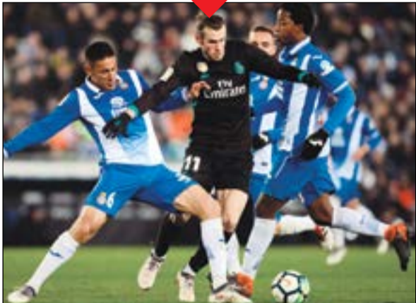
الويلزي يمر من مدافعي إسبانيول

دخل الويلزي غاريت بيل جناح ريال مدريد تاريخ الليغا، عقب مشاركته مع الفريق الملكي أمام إسبانيول، في الجولة الـ 26 من منافسات البطولة.