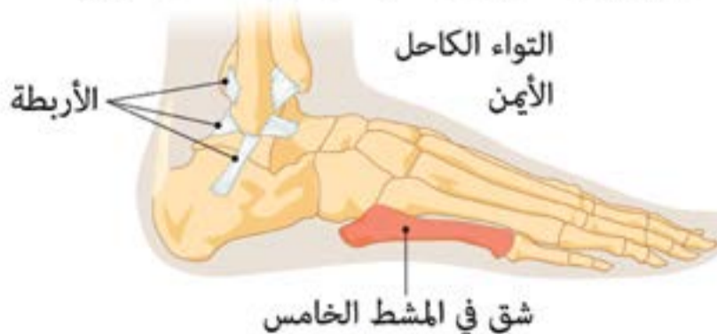
شق في المشط الخامس

يعاني نجم نادي باريس سان جرمان من التواء في الكاحل وشق في مشط القدم