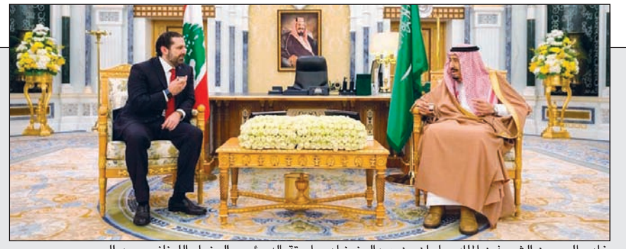
خادم الحرمين الشريفين الملك سلمان بن عبدالعزيز لدى استقباله رئيس الوزراء اللبناني سعد الحريري

خادم الحرمين الشريفين الملك سلمان بن عبدالعزيز يستقبل رئيس الوزراء اللبناني سعد الحريري في أول زيارة له بعد التراجع عن الاستقالة 29