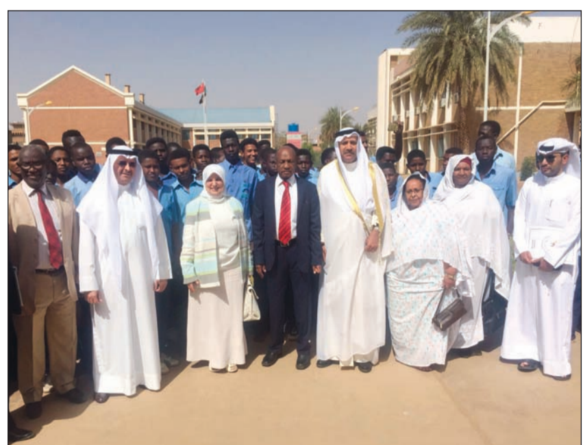
الوزيرة هند الصبيح خلال اللقاء مع وزير العمل والإصلاح الإداري السوداني بابكر نهار

ووفقاً لمصادر مطلعة بوزارة الشؤون، فإنه «تم السماح للمجمعات الخيرية بالمشاركة في