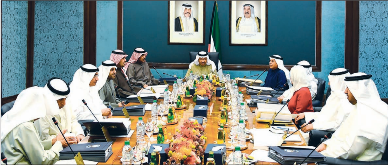
سمو الشيخ جابر المبارك مترئساً الاجتماع الأسبوعي لمجلس الوزراء

فريق من «أمانة الوزراء» و«المالية» و«الفتوى» و«المراقبين» لحسم ملف العهد مع «المحاسبة»