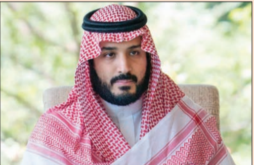
صاحب السمو الملكي الأمير محمد بن سلمان

الوزراء قد أصدر قراراً بتاريخ 2017/7/24 بتكليف ديوان المحاسبة بالتحقق من الحسابات العامة لكل الجهات الحكومية خلال السنة المالية 2017/2016، والتحقق من مدى وجود تجاوزات في هذا الخصوص من عدمه، وجاءت مبادرة المجلس في إطار المساعي التي تبذلها الحكومة وحرصها على المعالجة الشاملة لملف العهد، والذي تراكم عبر عدد من السنوات. التفاصيل ص 2