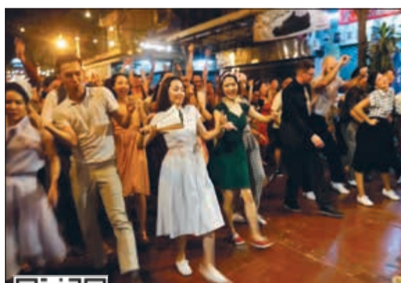
الاجيال الشابة تبدي اهتماما متزايدا برقصات سوينغ