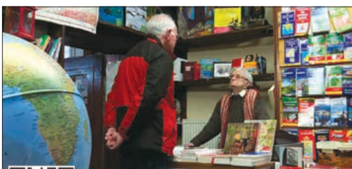
لائزال أكبر بائعة للكتب سنا في بلادها تمارس نشاطها في سن الخامسة والتسعين

العميدة فايهي تواظب على العمل في سن 95 عاما