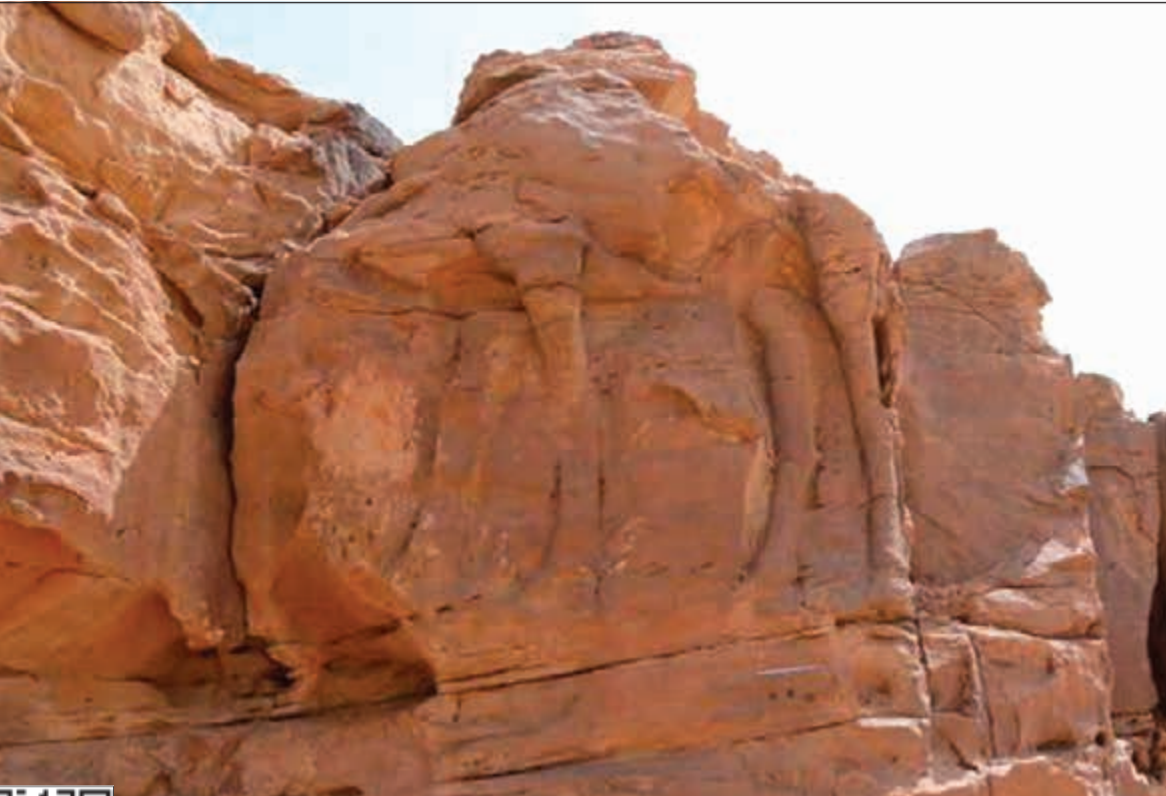
منحوتة تخفي الكثير من الالغاز