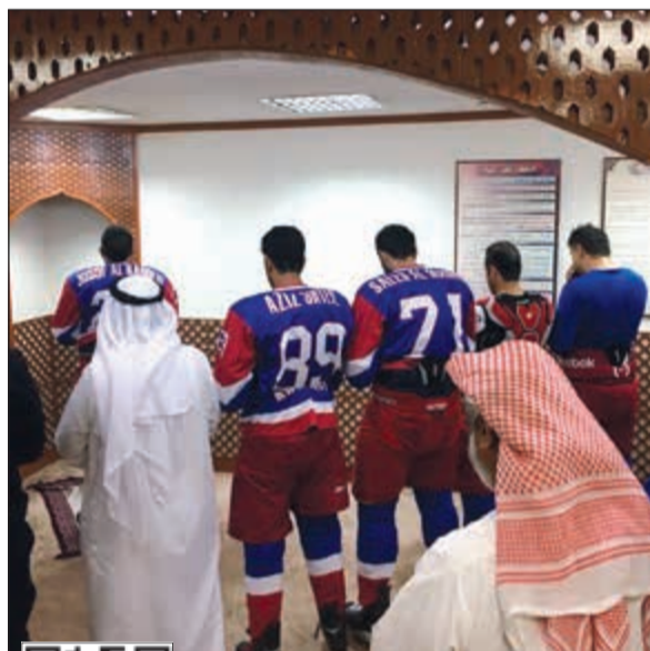
مجموعة من اللاعبين والإداريين خلال الصلاة