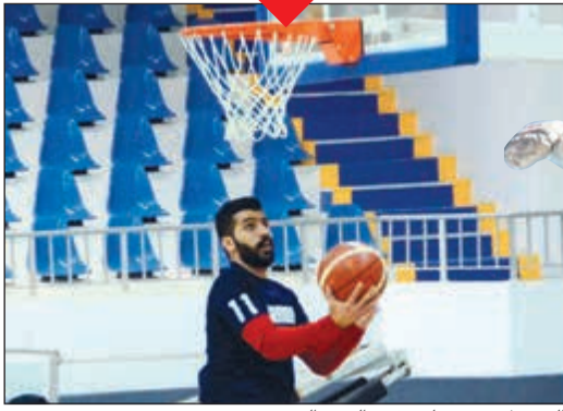
اليرموك يسعى لتحقيق الفوز اليوم