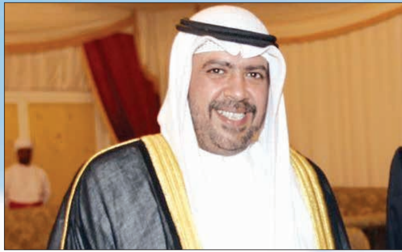
الشيخ أحمد الفهد

نود أن نشكر الجمهورية الكورية، اللجنة الأولمبية الدولية والرياضيين الآسيويين ولجانهم الأولمبية الوطنية التي شاركت في بيونغ تشانغ 2018 لجعل الألعاب متميزة. نحن نتطلع الآن إلى الألعاب الأولمبية الصيفية في طوكيو 2020 والألعاب الأولمبية الشتوية في بكين 2022، ونحن متأكدون أننا سننظر مرة أخرى للعالم التزام القارة الآسيوية بالحركة الأولمبية ونوفر فرصة غير مسبوقة لتنمية الرياضة في المنطقة.