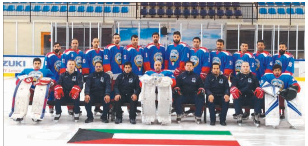
منتخبنا الوطني لهوكي الجليد