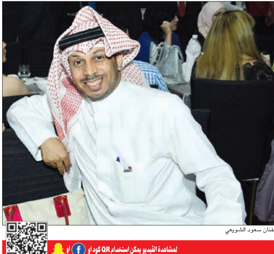
الفنان سعود الشويعي