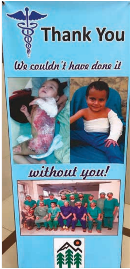
من الحالات التي تم علاجها في المخيمات الطبية الخيرية