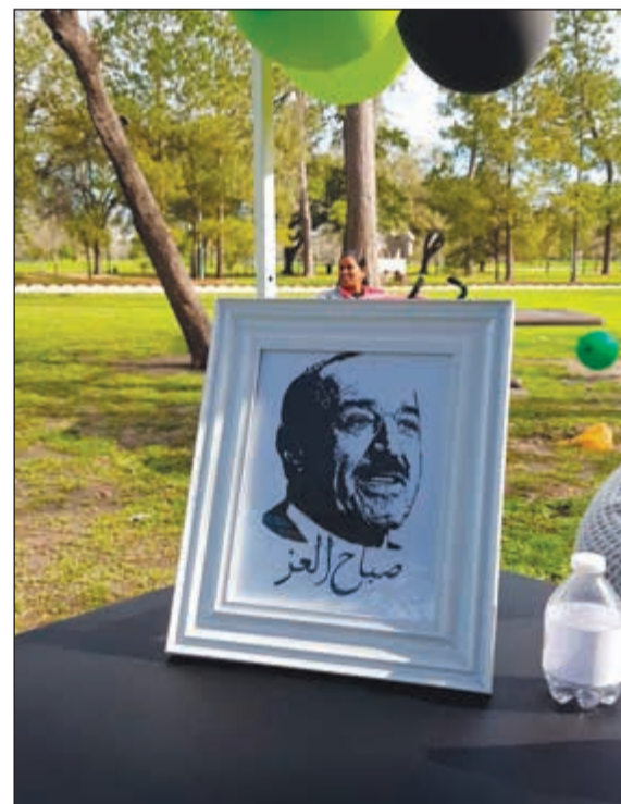
صورة لصاحب السمو الأمير الشيخ صباح الأحمد