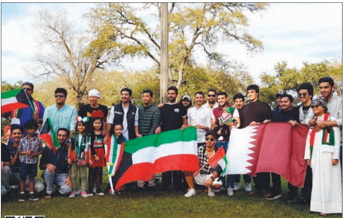
أعلام الكويت زينت الاحتفال ويبدو علم لدولة قطر الشقيقة