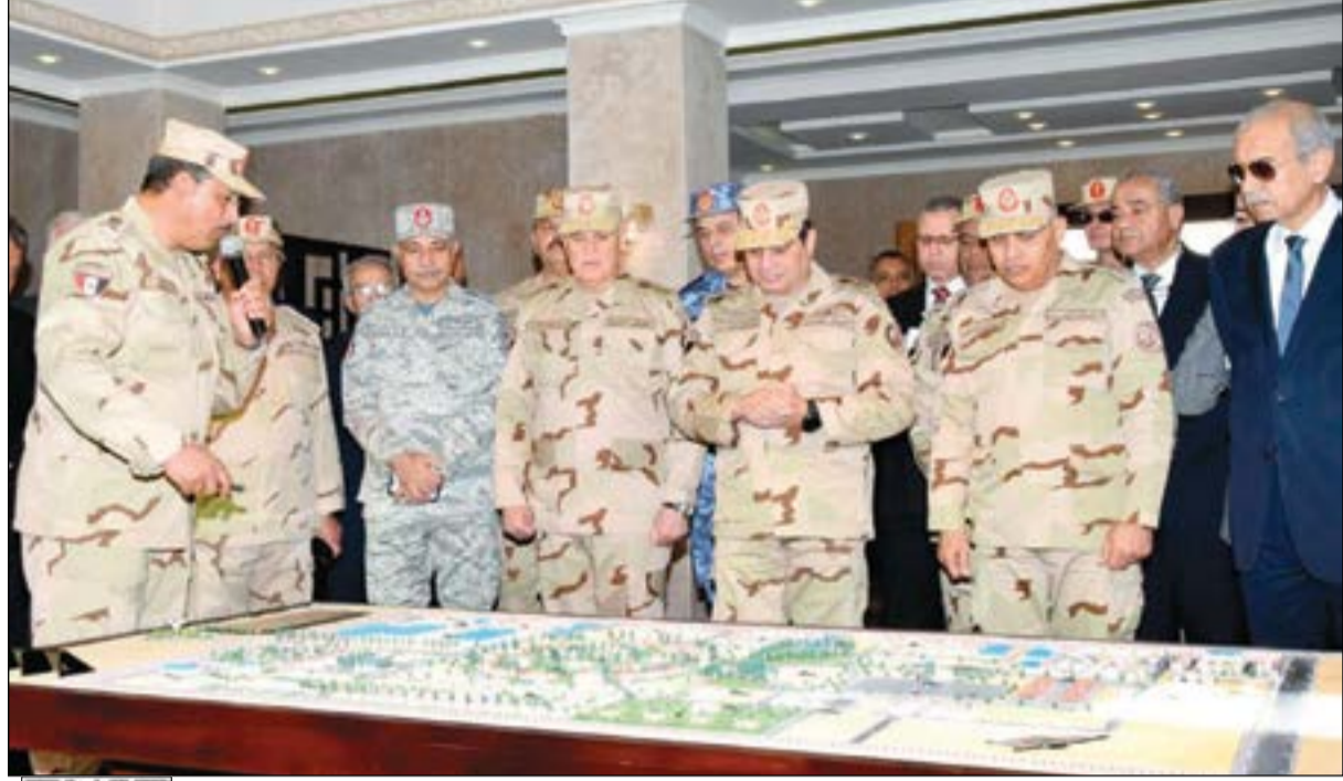
الرئيس عبد الفتاح السيسي خلال افتتاح قيادة قوات شرق القناة لمكافحة الإرهاب