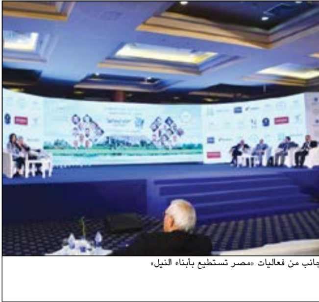
جانب من فعاليات «مصر تستطيع» بآبنا النيل