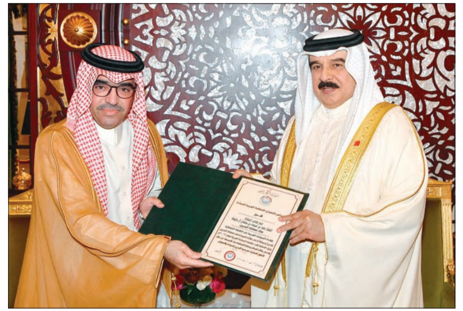
منح عاهل البحرين الملك حمد بن عيسى قلادة السياحة العربية من الطبقة الممتازة