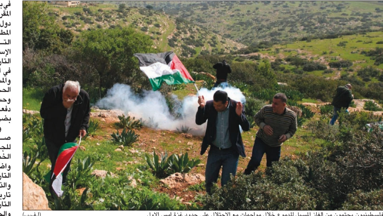
فلسطينيون يحمون من الغاز المسيل للدموع خلال مواجهات مع الاحتلال على حدود غزة امس الاول

إسرائيل. وحتى الآن تتعامل المحكمة العليا الإسرائيلية مع الدعاوى التي يقدمها فلسطينيون بشأن هذه القضايا، باعتبارها دعاوى ضد جيش الاحتلال. ويتم التوجه بهذه الدعاوى، المتعلقة بالإنتهاكات التي تمارسها إسرائيل ضد