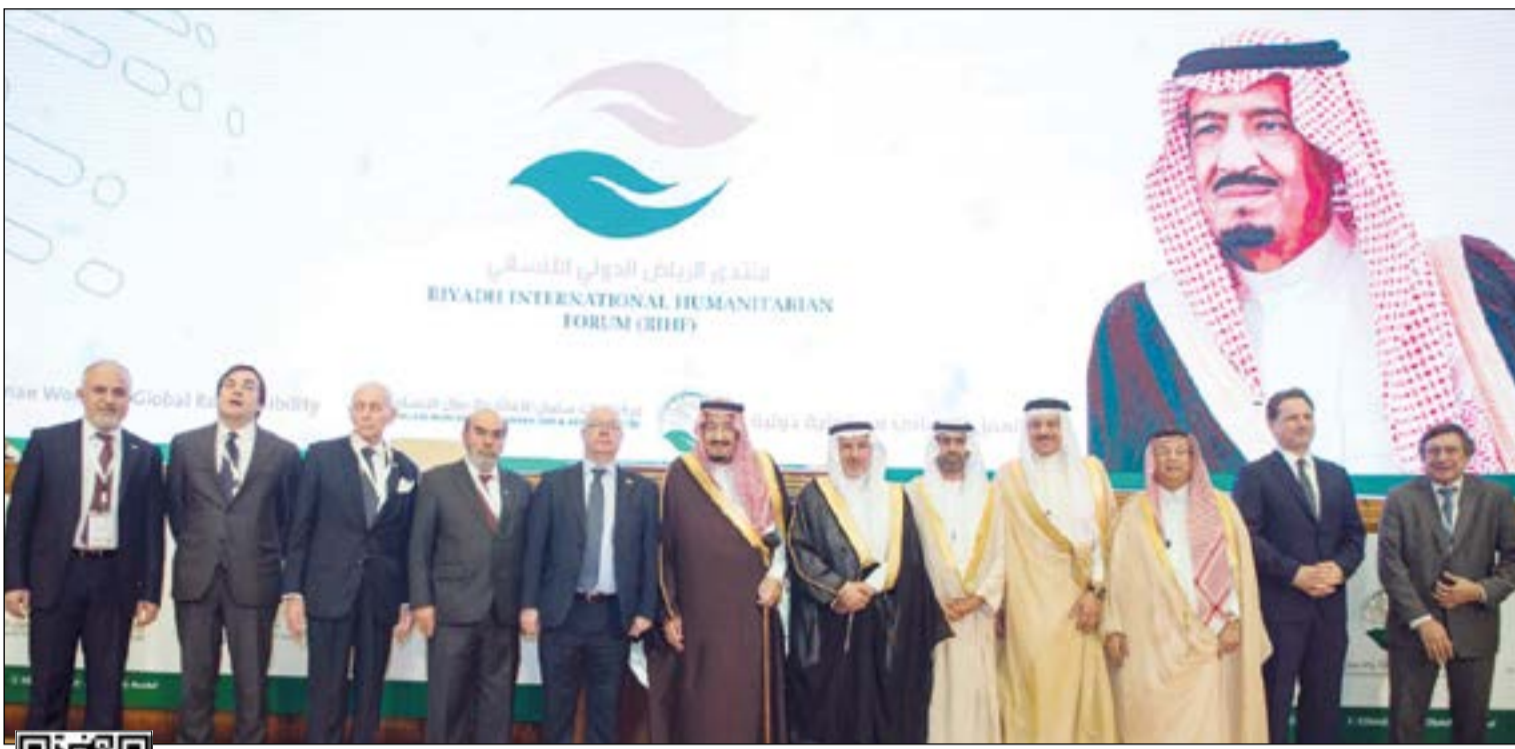
صورة جماعية للملك سلمان مع المشاركين في منتدى الرياض الدولي الإنساني