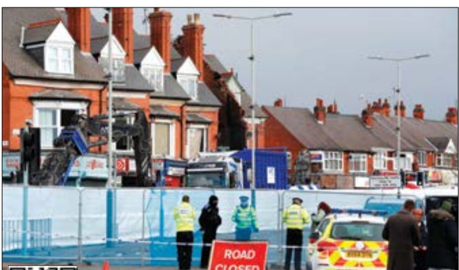
المبنى الذي شهد انفجار في «ليستر» حيث أغلقت الشرطة الطرق المؤدية إليه أمس