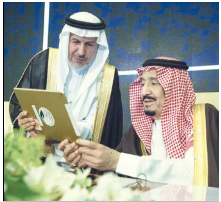
خادم الحرمين الشريفين يمدشنا منصة المساعدات الإنسانية