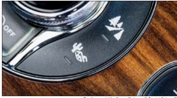
الكسوة الخشبية الجديدة (العنبر السائل) من Bentley