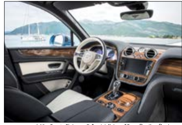
Bentley مع الكسوة الخشبية الجديدة (العنبر السائل)

راجستان وأندرا براديش في الهند، البلد الذي يتمتع بتاريخ قديم وغني في الأعمال البنائية الحجرية. يجري فصل أجزاء الحجارة من قطع كبيرة وتتم معالجتها باستخدام الزيوت الجذابة ومادة صمغية خاصة. وفي النهاية، يتم قطع الحجارة وفقاً للشكل المطلوب ثم صقلها يدوياً عبر فريق Mulliner الشهير عالمياً في مجال تصميم المقصورات الفاخرة والمتواجدة في مقر شركة Bentley في كرو بإنجلترا.