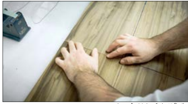
Bentley تضيف كسوة خشبية جديدة