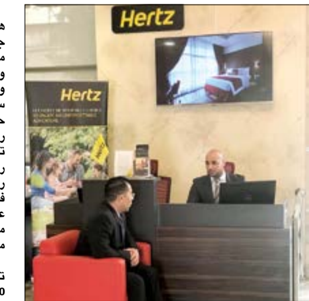
الفرع الجديد في فندق رامادا أونكور

جدير بالذكر أن شركة هرتز أقيمت تواجداً مميزاً جعل السفر معها أكثر متعة وراحة كما كان دائماً، ويفضل جهودها المتواصلة وخبرتها التي تزيد على 21 سنة في السوق الكويتي، حافظت خلالها هرتز على رضا عملائها، استجبت أن تكون الخيار الأول لكل من رجال الأعمال والسائحين. كما رسخت شركة هرتز قواعدها في السوق العالمي كشركة عريقة بلا منازع مما لديها من قدرة تنافسية عالية في مجال تأجير السيارات. جدير بالذكر أن هرتز احتفلت بمناسبة مرور 100 عام على تأسيسها حيث تقدم لجميع العملاء لدى قيامهم بالحجز الميكرو خصومات تصل لغاية 20٪ وذلك قبل تاريخ 26 فبراير 2018 للحجوزات لغاية 23 مارس 2018. وتشتهر هرتز بامتلاكها مجموعة واسعة من السيارات عالية الجودة (السيارات الصغيرة، سيارات الدفع الرباعي الكبيرة، سيارات الرفاهية ونافلات الأشخاص الصغيرة)، علاوة على خدمات تأجير السيارات المتنوعة والفريدة من نوعها مثل تأجير السيارات اليومي والأسبوعي والشهري.