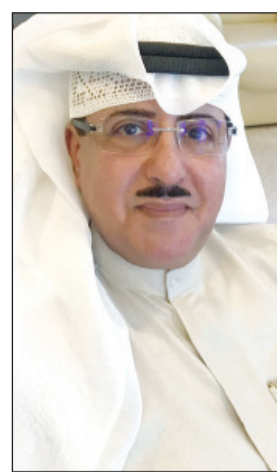
الشيخ فهد المبارك

في جميع محطات إذاعة الكويت نفذها باقتدار مدير إذاعة البرنامج العام سعد الفندي بعمل فرق عمل تتولى مهمة التغطية لهذا الحدث الجميل للكويت وأميرها، حفظه الله ورعاه، فكانت تغطية مميزة استطاعوا خلالها توصيل صوت الكويت بكل مهنية إلى أرجاء