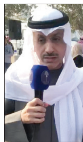
وكيل وزارة الإعلام طارق المزرم

الإذاعة الشيخ فهد المبارك، حتى يتعرف القاصي والداني عن قرب على فرحة الشعب الكويتي بالعيد الوطني وعيد التحرير، خصوصا أن إذاعة الكويت لها مستمعون كثر في جميع الدول العربية. التعليمات التي صدرت من وكيل الإذاعة الشيخ فهد المبارك بتوحيد البث