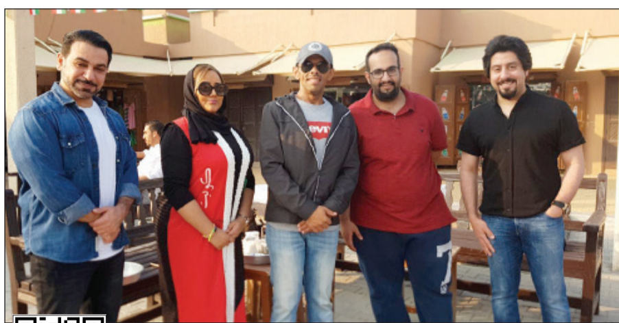
فريق برنامج «باركي يا كويت» في يوم البحار

العديد من الضيوف داخليا وخارجيا للحديث عن العيد الوطني وعيد التحرير وما يحملونه من حب لهذه الأرض الطيبة مركز العمل الإنساني بعد تسمية قائدها ورمزها صاحب السمو الأمير الشيخ صباح الأحمد قائدا إنسانيا لأعماله الخيرية التي لا تعد ولا تحصى. وقد أشاد وكيل وزارة الإعلام طارق المزرم بالجهود التي تبذلها إذاعة وتلفزيون الكويت في رصد فرحة أهل الكويت والمقيمين على أرضها بالاحتفالات الوطنية من مواقع خارجية متعددة، مشيرا إلى أن إذاعة الكويت بجميع محطاتها دائما تكون على مستوى الحدث، وهذا يدل على أن القائمين عليها حريصون دائما على التميز في تغطياتهم للمناسبات التي تقام في البلاد.