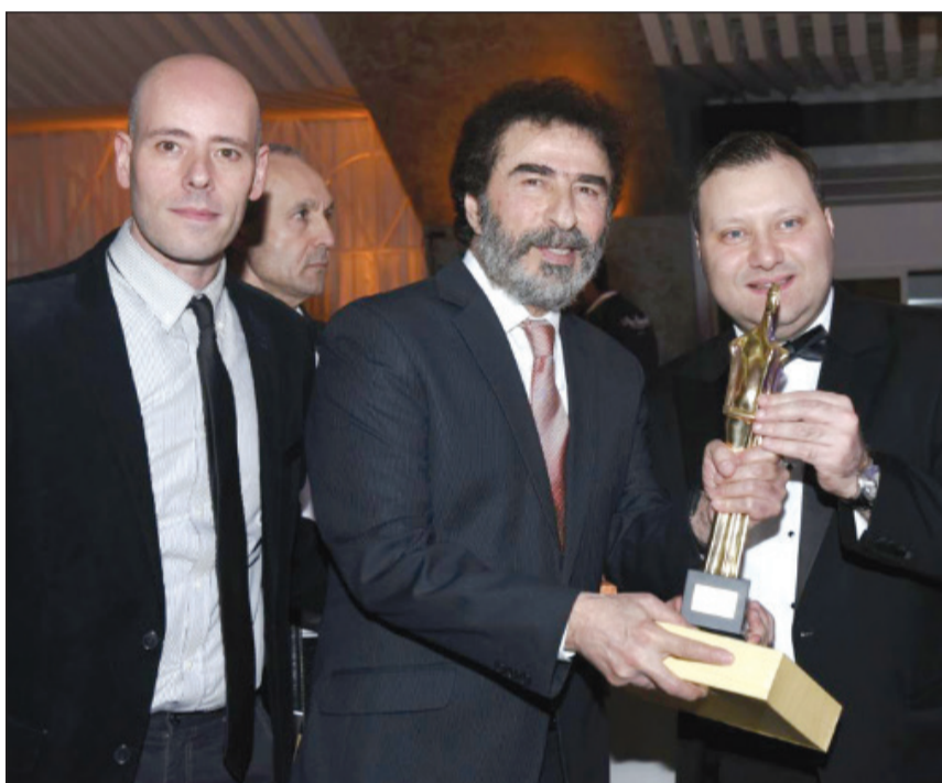
رشيد عساف أثناء تكريمه في يوم «بيروت للجوائز الذهبية»

عادته وتقاليده وارثه الحضاري، لذلك نعمل جاهدين على أن تقدم الأعمال التاريخية، والأعمال البيئية، والمسرحيات الهادفة، والأفلام السينمائية التي تلخص حكايات وقصصا خلال ساعة ونصف الساعة من الفيلم الذي يشاهده جمهور محب للسينما. كما كشف النجم رشيد عساف عن أنه سيجل أيضا ضيف شرف على مهرجان الفنون الذي سيقام بالمنطقة السياحية دبا الفجيرة في الإمارات العربية المتحدة، بحضور نخبة من نجوم الوطن العربي. من جهة أخرى، لم يعلن عساف عن أي مشروع درامي جديد للموسم المقبل، بعد انتهائه من تصوير دوره في مسلسل «الواق» في الوقت الذي أعلن فيه انسحابه من الجزء الخامس، من مسلسل «طوق البنات»، وفي الوقت نفسه يعرض له مؤخرا مسلسل «الغريب» الذي تم تصويره العام الماضي.