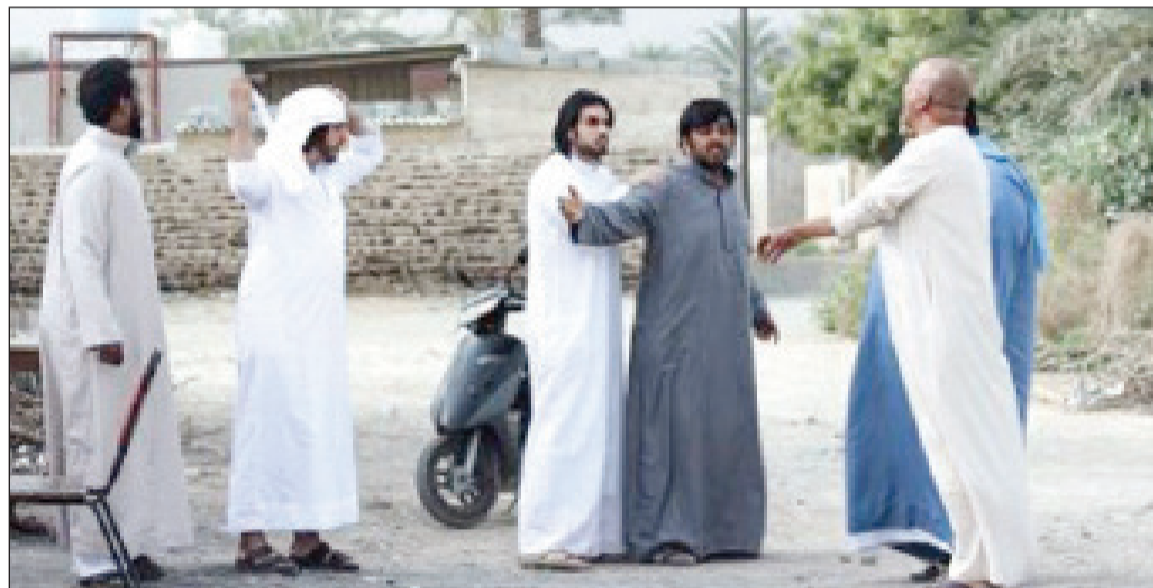
مشهد من الفيلم

وتدور أحداث «فريج الطيبين» في نحو 90 دقيقة، وهو من تأليف وإنتاج وإخراج المخرج الإماراتي أحمد زين، بدعم من مجموعة أبو ظبي للثقافة والفنون، ومن بطولة عبدالله الجنيني، محمد مرشد، هدى الغانم، إيمان