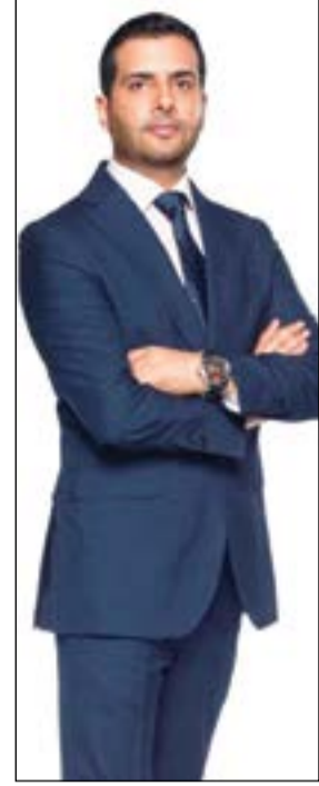
الإعلامي السعودي إبراهيم الفرحان

الفرحان: الحلقة ستكشف الكثير من الحقائق واستغرق إعدادها قرابة الـ 4 أشهر