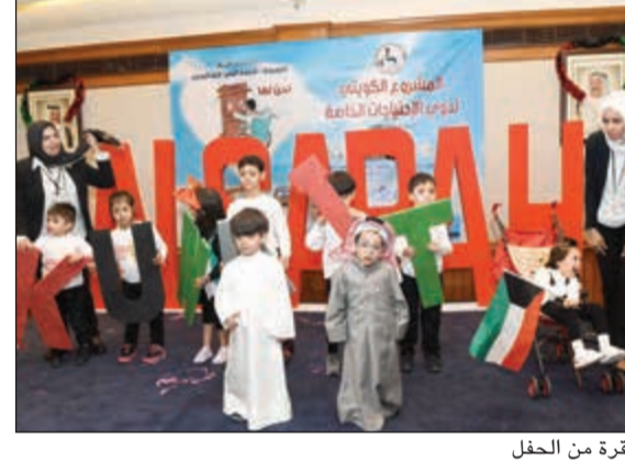
فقرعة من الحفل