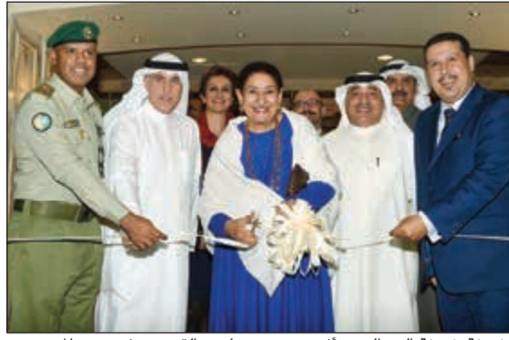
الشيخة شيخة العبدالله ورافقت صبحي وناصر القيسي يفتتحون المعرض