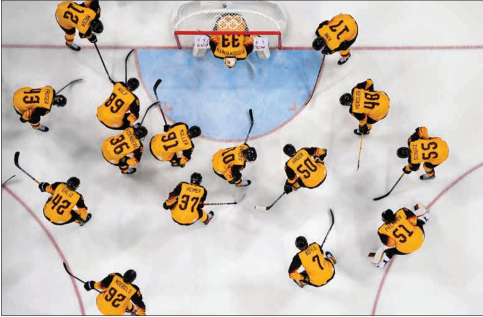
المنتخب الألماني تأهل إلى نهائي هوكي الجليد على حساب حامل اللقب كندا 4 - 3 في أكبر مفاجآت البطولة وسيواجه روسيا التي هزمت تشيكيا 3 - صفر