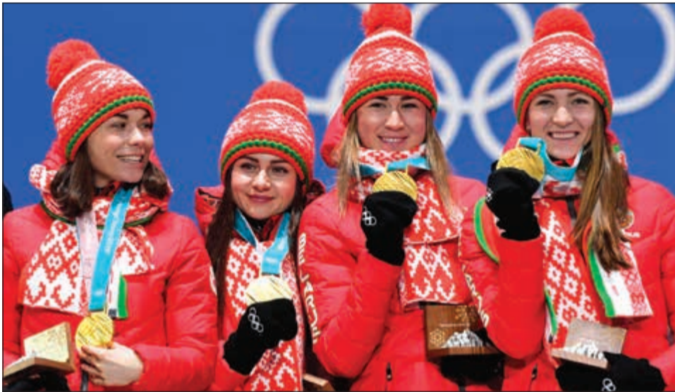
لاعبات بيلاروسيا يحتفلن بذهبية البياتلون (6x4 كم تتابع)