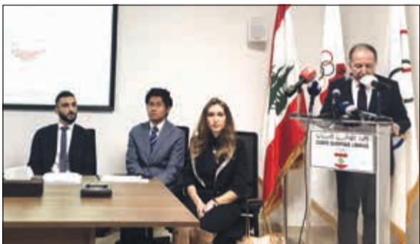
رئيس اللجنة الأولمبية اللبنانية متحدثاً في حضور وفد المجلس الأولمبي الآسيوي