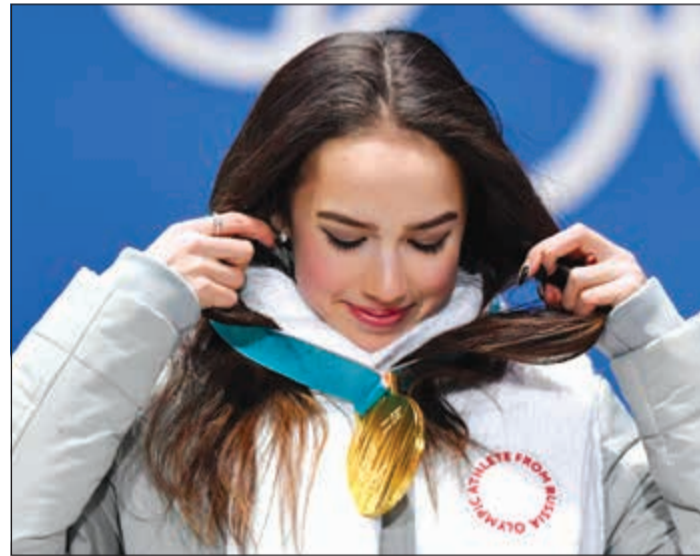
الروسية ألينا زاغيتوفا (15 عاماً) تحمل ذهبية التزلج الفني