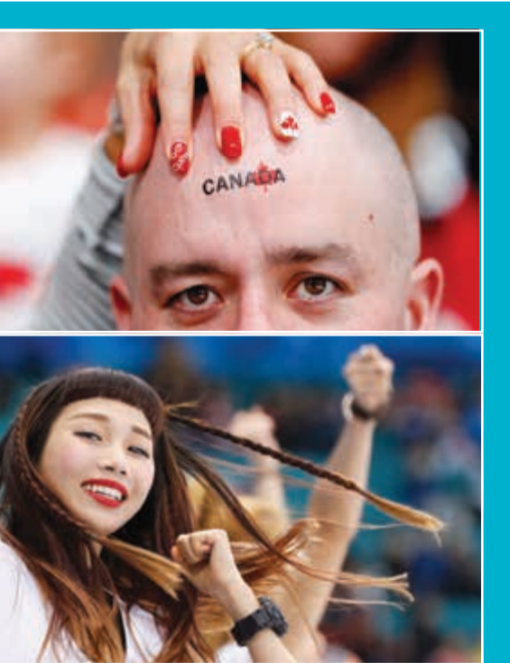
من فنون التشجيع في الأولمبياد الشتوي