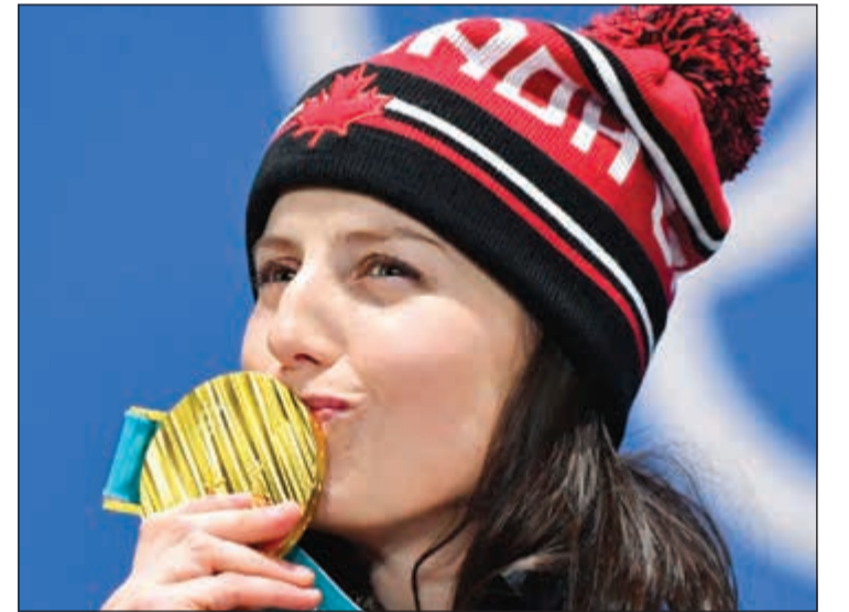
الكندية كسلي سروا تحتفل بذهبية التزلج الحر