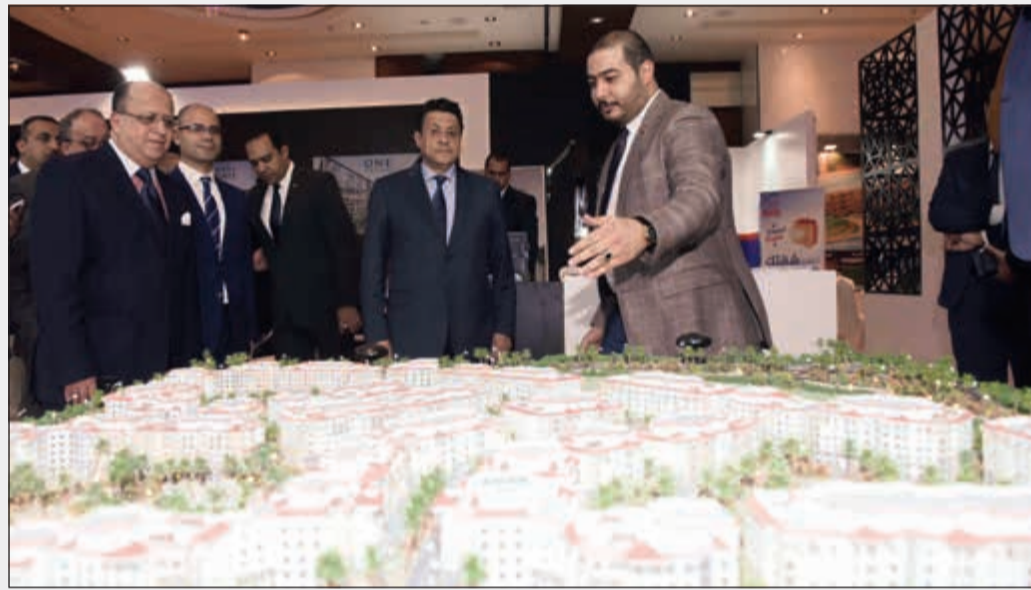
السفير طارق القوني مستمعاً لشرح حول أحد المشاريع المشاركة في المعرض