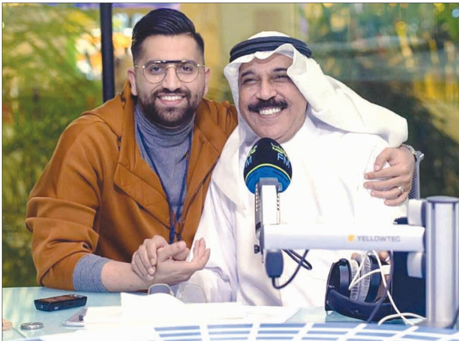
سفير الأغنية الكويتية والخليجية عبدالله الرويشد مع الاعلامي علي نجم في استديو مارينا FM 90.4

وحول بعض الآراء التي ترى أنه يكرر مجموعة من الأغنيات في كل الحفلات، قال «كل شخص له وجهة نظر وهناك من يتطلع لأغنية ما لأنها مرتبطة بذكري في حياته وتجده