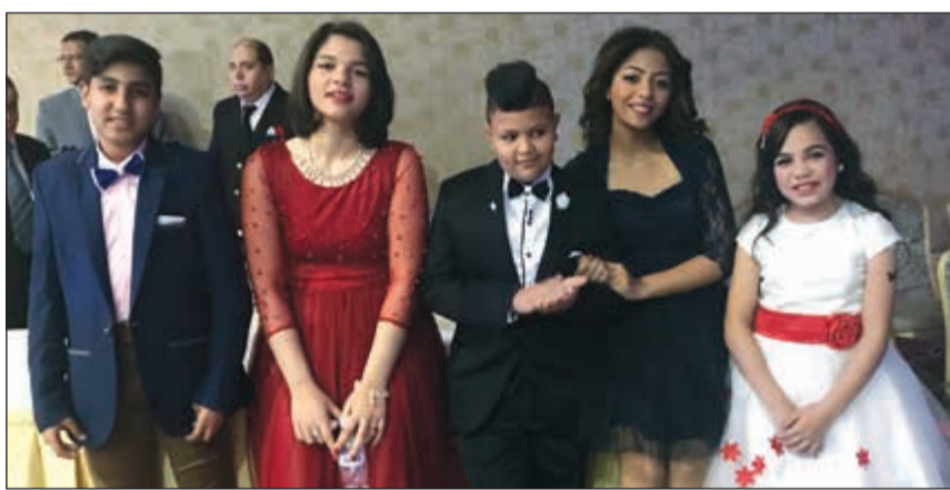
نجوم «ذا فويس كيدز» قبل الحفل

مجاني للزوار. وصرح سليم لـ«الأنباء» بأن جديد الأغاني هذا العام أغنية جديدة أهداه للكوييت من الحان د.احمد عبدالله المايسترو الذي أتى من مصر، وكلمات الاستاذ مختار وهي مصرية كويتية أهداه من المصري لشقيقه الكويتي وتعبير عن عمق العلاقة بينهم بعنوان «أخي الشقيق» وأغنية بثت على قناة «سكوب» الكويتية صباحا على الهواء، ولاقت استحسانا جماهيريا وردودا طيبة.