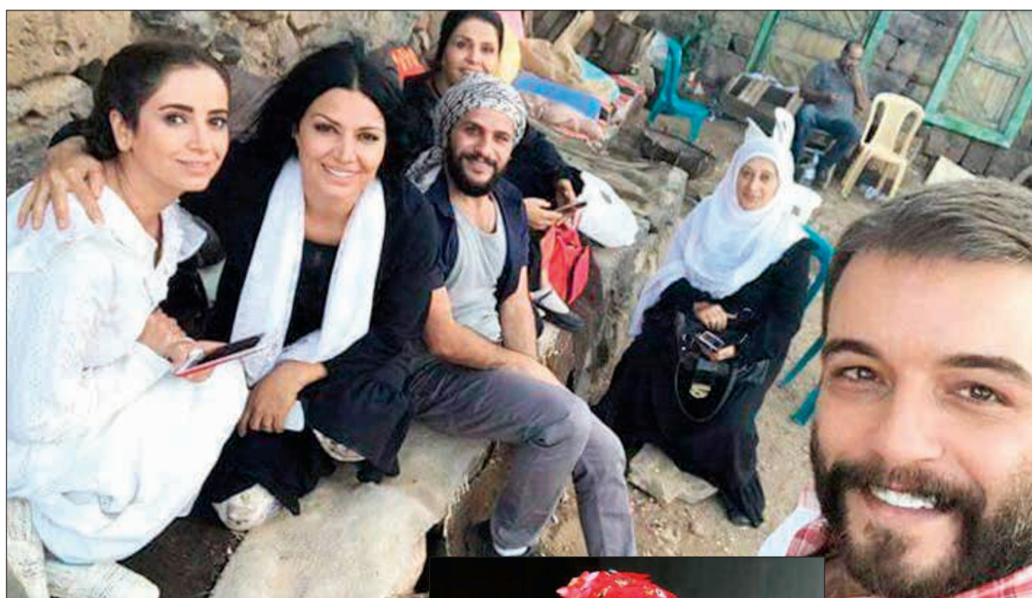
في موقع تصوير «وحدن»