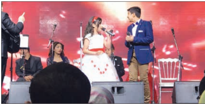
إحدى فقرات «ذا فويس كيدز»