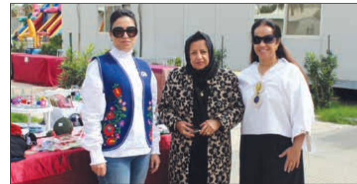
دلال الرومي متوسطة مشاركتين بالمهرجان