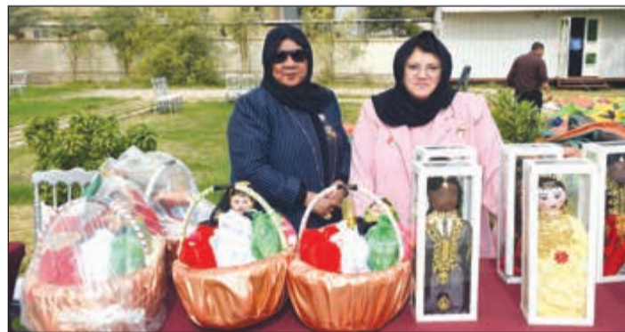
طيلة السلطان ورافطة قبايزر يعرضان مشغولاتهما اليدوية «هاند ميه» (متين غوزال)