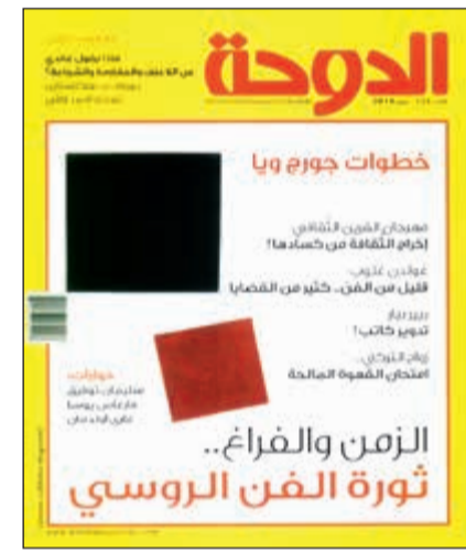
غلاف مجلة «الدوحة»

صدر عدد جديد من مجلة «الدوحة» الثقافية، رقم 124 لشهر فبراير الجاري، والتي تصدرها وزارة الثقافة والرياضة في قطر، ويتضمن العدد مجموعة متنوعة من الموضوعات والأخبار الثقافية والمقالات، واشتمل العدد على تقرير خاص عن فعاليات مهرجان القرين الثقافي في دورته الـ24، ملقيا الضوء على التوصيات الختامية للمهرجان بإخراج الثقافة العربية من كسادها وكيفية الاستغلال الأمثل للفرص الثقافية العربية بكل تجلياتها من خلال تكامل الأدوار وحشد الجهود بين الدول العربية بهدف توظيف الثقافة كاستثمار بشري طويل.