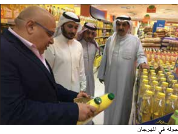
جولة في المهرجان

الخصومات المميزة في المهرجان بمناسبة الأعياد الوطنية حيث ستكون الأسعار في متناولهم، موضحا أن المهرجان سيكون فقط بالأسواق المركزية كما تم إعطاء تعليمات لمسؤولي الأسواق المركزية بمنع أصحاب البقالات في سحب كميات كبيرة من العروض فالأولوية للمساهمين ورواد الجمعية. من جانبه، هنا أمين الصندوق منصور السبيعي صاحب السمو الأمير الشيخ صباح الأحمد وسمو ولي عهده الأمين الشيخ نواف الأحمد والحكومة الرشيدة