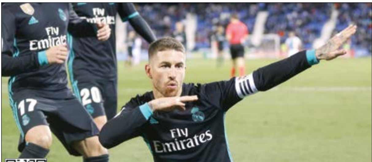
سيرخيو راموس محققا بالهدف الثالث للملكي

يخوض كلارنس سيدروف قائد الجهاز الفني لديبورتيفو لاكرونيا اختبارا آخر مع فريقه في 11,00 مساء اليوم فيلتقي مع إسبانيول والذي يقبع في المركز السادس عشر في قائمة الترتيب العام، وبعد خسارتين متتاليتين في بطولة الدوري يسمى سيدروف إلى تحقيق الانتصار وإظهار قدرة الفريق على تجاوز المنافس.