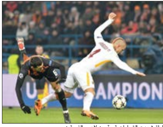
المباراة شهدت التحامات قوية بين لاعبي الفريقين

مفاجئ، ولعب ياروسلاف رايكتسكي تمريرة طويلة ففضل اليساندرو فلورينتسي في التعامل معها لتصل من أميركا الجنوبية في تشكيلته الأساسية من بينهم مارلوس الذي يلعب حاليا مع منتخب أوكرانيا.