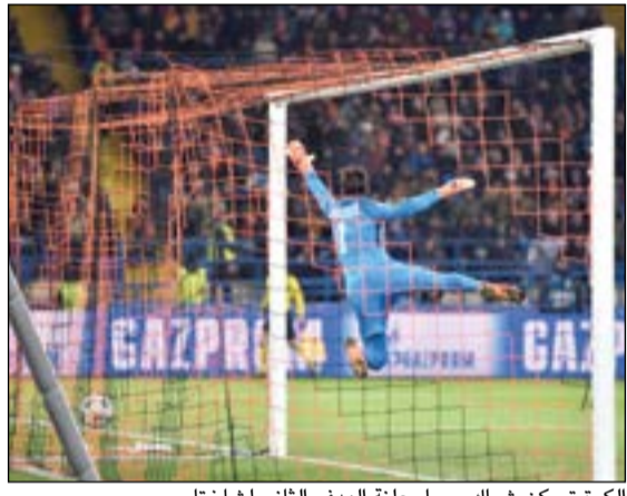
الكرة تسكن شباك روما معلنة الهدف الثاني لشاختر