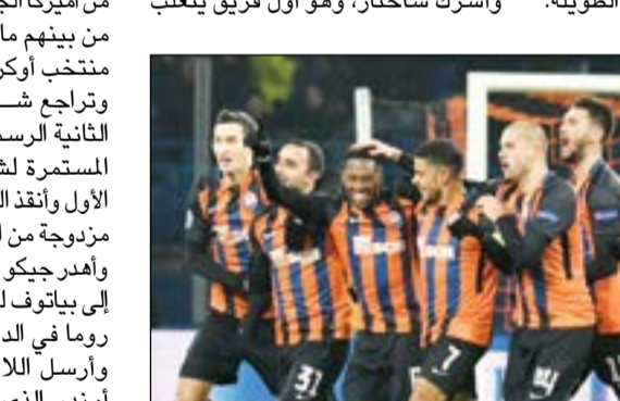
فرحة لاعبي شاختر بتحويل الخسارة إلى فوز غال

السبب الوحيد لعدم انتصارنا نتيجة كبيرة هو تالق حارس روما». وأشرك شاختر، وهو أول فريق يتغلب