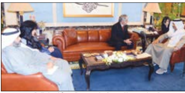
سمو رئيس الوزراء مستقبلاً سفير كوبا بحضور الشيخة اعتماد الخالد

استقبل سمو رئيس مجلس الوزراء الشيخ جابر المبارك في قصر السيف أمس كلاً على حدة سفير جمهورية كوبا الصديقة لدى الكويت فيرناندو بيريز مازا وسفيرة الجمهورية التركية الصديقة لدى الكويت عائشة هلال سايبان كويتاكو وسفيرة الجمهورية الفرنسية الصديقة لدى الكويت ماري ماسدوبي وسفير جمهورية الهند الصديقة لدى الكويت ك. جيفا ساغار.