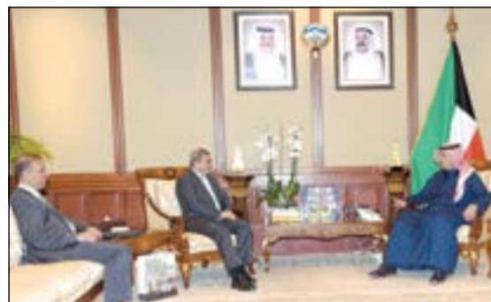
أنس الصالح مستقبلاً سفير العراق علاء الهاشمي

كذلك استقبل الصالح أمس سفير العراق لدى الكويت علاء الهاشمي وسفيرة تركيا عائشة كويتاكو كلاً على حدة. وأعرب السفير العراقي خلال اللقاء عن امتنانه للجهود المبذولة من الكويت لدعم العراق المستمر.