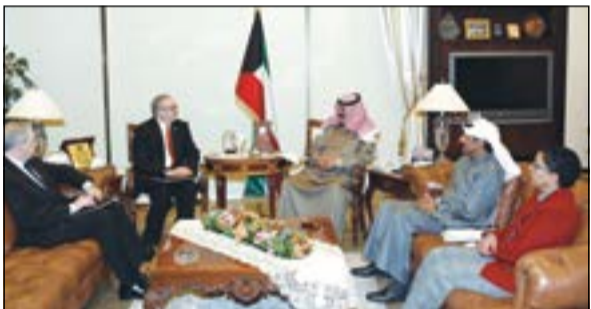
نائب وزير الخارجية مستقبلاً السفير الأميركي لورانس سيلفرمان