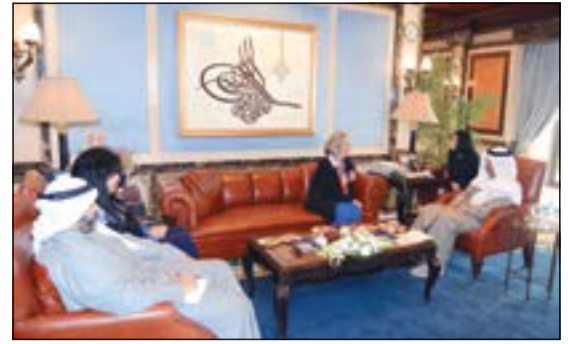
جانب من استقبال سمو رئيس الوزراء للسفيرة الفرنسية ماري ماسدوبي