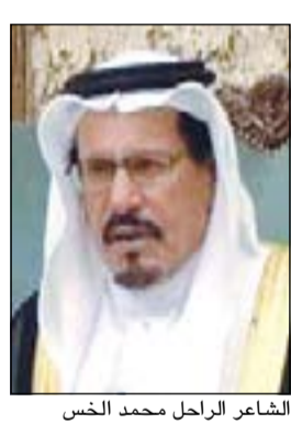
الشاعر الراحل محمد الخس