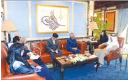
سمو الشيخ جابر المبارك خلال استقبال سفير الهند ك.جيف ساغار