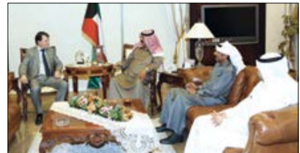
خالد الجارالله خلال لقائه السفير الروسي اليكسي سولوماتين

باليمين. وتم في اللقاء بحث عدد من أوجه العلاقات الثنائية بين البلدين إضافة إلى تطورات الأوضاع على الساحتين الإقليمية والدولية. حضر اللقاء مساعد وزير الخارجية لشؤون مكتب نائب الوزير السفير أيهم العمر.