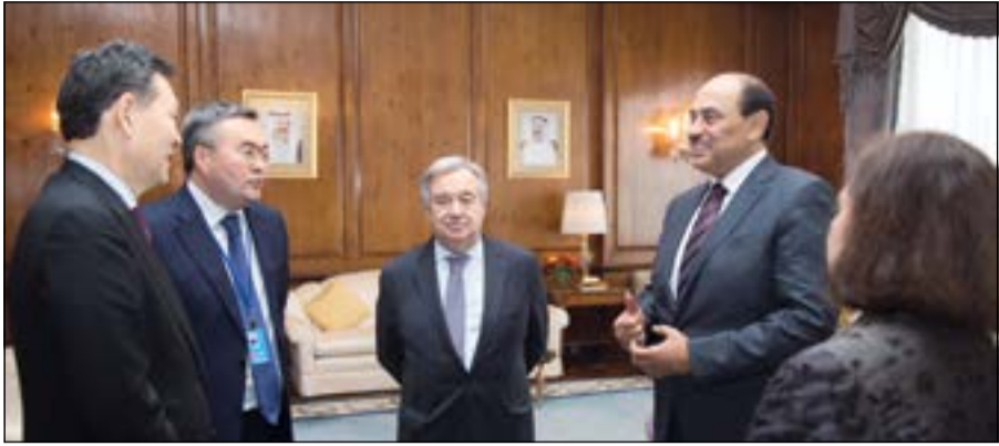
الشيخ صباح الخالد مرحبا بالضيوف

ترأس نائب رئيس مجلس الوزراء ووزير الخارجية الشيخ صباح الخالد جلسة مجلس الأمن رفيعة المستوى حول أهداف ومبادئ ميثاق الأمم المتحدة التي دعت الكويت لعقدتها تحت عنوان «مبادئ ومقاصد ميثاق الأمم المتحدة في صيانة السلم والأمن الدوليين» لمناقشة سبل تحسين كليات منظمة الأمم المتحدة وتعزيز فعاليتها للحد من المخاطر والتهديدات التي تواجه المجتمع الدولي.