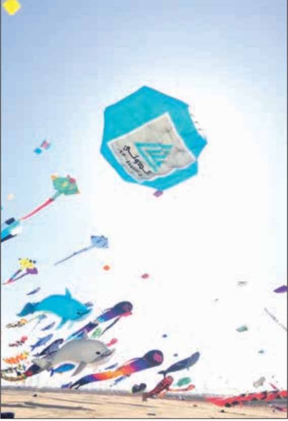
مهرجان الفارسي للطائرات الورقية