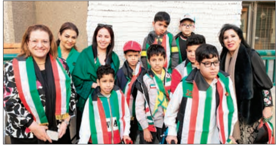
لقطة مع عدد من الطلبة

تزامنا مع الاحتفالات بالأعياد الوطنية، استقبل فريق العلاقات العامة طالبات وطلبة مدرستي الرجاء البنات والبنين التابعين لإدارة التربية الخاصة، بهدف مشاركة أسرة البنك التجاري احتفالات ذكرى اليوم الوطني السابع والخمسين ويوم التحرير السابع والعشرين للكويت، وذلك بحضور كل من رئيس مجلس الإدارة علي الموسى ونائب الرئيس الشيخ احمد الدعيج، ورئيسة الجهاز التنفيذي الهام محفوظ والإدارة التنفيذية وموظفي البنك.