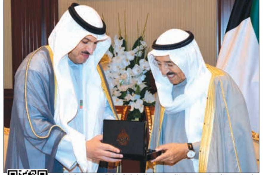
صاحب السمو الامير الشيخ صباح الاحمد يتسلم المسكوكة التذكارية من د.محمد الهاشل