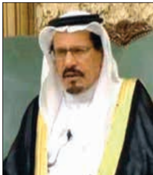
الغفور له بإذن الله الشاعر الكبير محمد خلف الخس

رحيل الشاعر الكويتي الكبير محمد خلف الخس الذي لقبه مؤسس السعودية بـ «بستان الشعر» 39