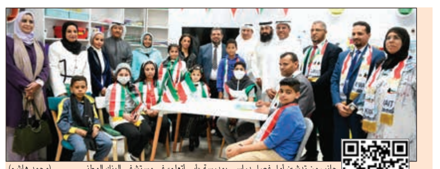
جانب من تشييد أول فصل دراسي بمدرسة «أبي أنعم» في مستشفى البنك الوطني

«الوطني» يكرم «النخبة» من موظفيه المتميزين 29