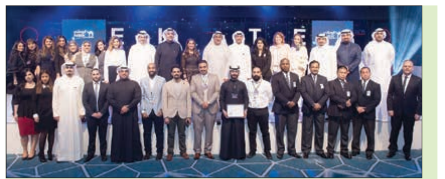
قيادات البنك مع مجموعة من المكرمين

«الوطني» يكرم «النخبة» من موظفيه المتميزين 29