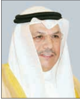
الشيخ خالد الجراح

رحيل الشاعر الكويتي الكبير محمد خلف الخس الذي لقبه مؤسس السعودية بـ «بستان الشعر» 39