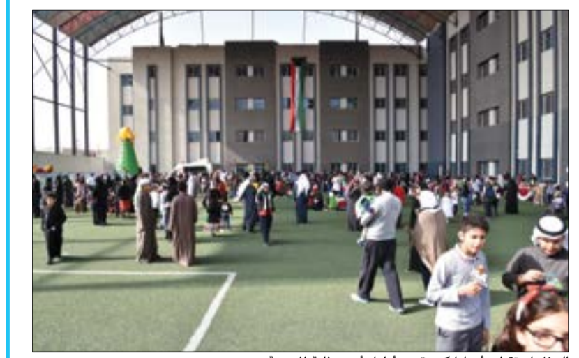
الحفل استقطب أعداداً كبيرة من أولياء أمور طلبة المدرسة

أصدر وكيل وزارة التربية د.هيثم الأثري تعميماً لجميع العاملين بمدارس التعليم العام والإدارات العامة للمناطق التعليمية بشأن اعتماد الإجازات المرضية الصادرة عن المراكز الطبية والمستشفيات الأهلية، لذا يحظر على العاملين بمدارس التعليم العام منح أو اعتماد الإجازات المرضية الصادرة عن المراكز الطبية أو المستشفيات الأهلية إلا عن طريق المنطقة التعليمية بمخاطبة المجلس الطبي العام. أما العاملون بإدارة التعليم الديني وإدارة مدارس التربية الخاصة وإدارة التعليم الخاص وكل العاملين بقطاعات الوزارة المختلفة فيعيد لإدارة الموارد البشرية القيام بإجراءات مخاطبة المجلس الطبي العام عن ذات الإجازات المنوه عنها وعلى جميع المعنيين في التعميم الالتزام بما أشير إليه اعلاه، وعلى جهات الاختصاص العلم والتنفيذ.