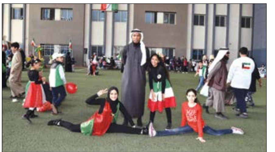
انشطة متنوعة استعداداً لفقرات الحفل

وسيكون هناك يوم ترفيهي داخل الصف. وقال إن ذلك من شأنه غرس الروح الوطنية لدى الطلاب وأن نمشي لديهم الانتماء إلى الأرض التي يعيشون عليها. وبين أن المدرسة تضم العديد من الجنسيات ولكن في العيد الوطني والتحرير نحتفل جميعاً بهذه المناسبة الغالية على قلوبنا، وهنا الشعب والحكومة الكويتية بالأعياد الوطنية وتمني للكويت الأزدهار والتقدم الدائم على جميع الأصعدة.