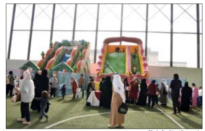
جانب من الاحتفال بأعياد الكويت