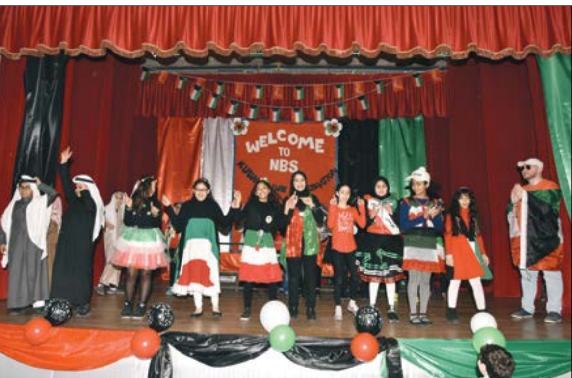
إحدى فقرات من الحفل قدمها الطلاب