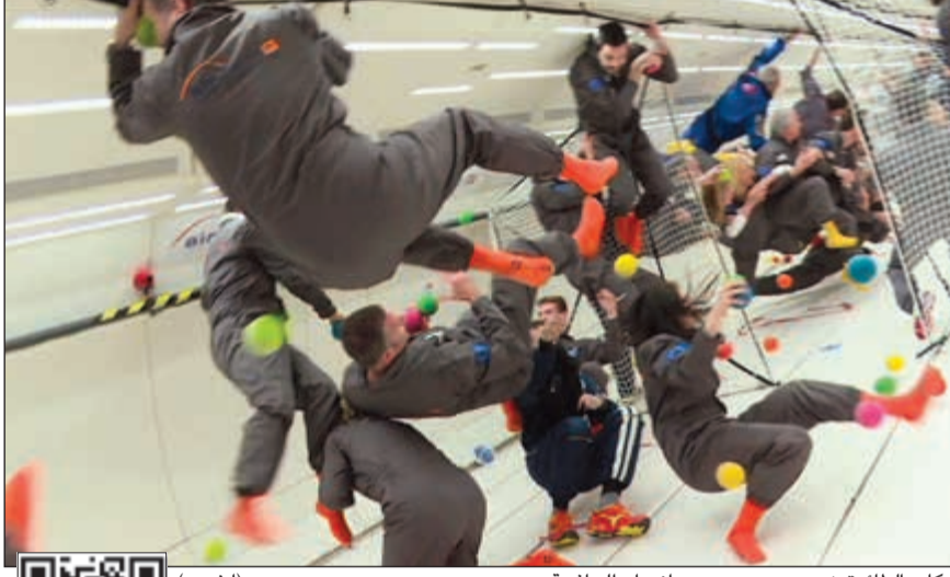
ركاب الطائرة زيرو جي يجربون «انعدام الجاذبية»

يمكن استخدام QR كود أو مشاهدة الفيديو أو يمكن استخدام QR كود أو