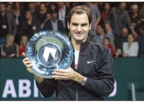
الأسطورة روجر فيدرر