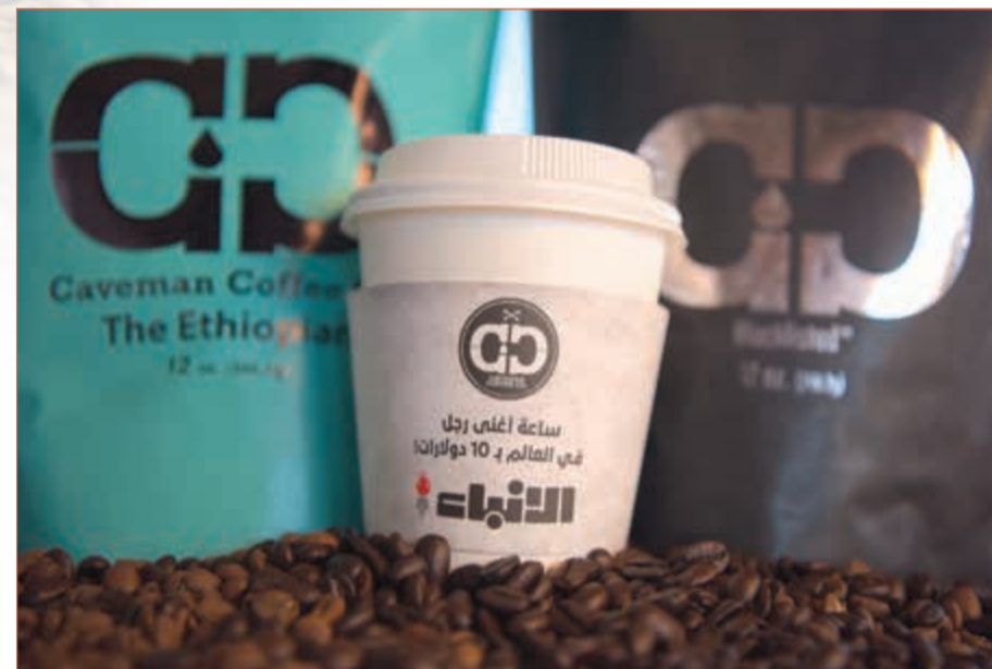
شراكة جديدة بين جريدة «الأنباء» ومقهى caveman