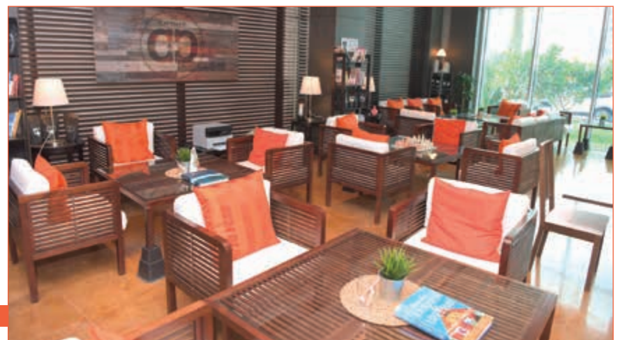
مقهى caveman.. راحة ومتعة وفائدة