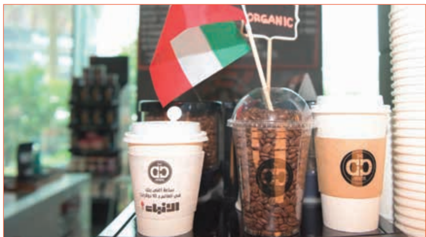
أجود أنواع البرق في مقهى caveman