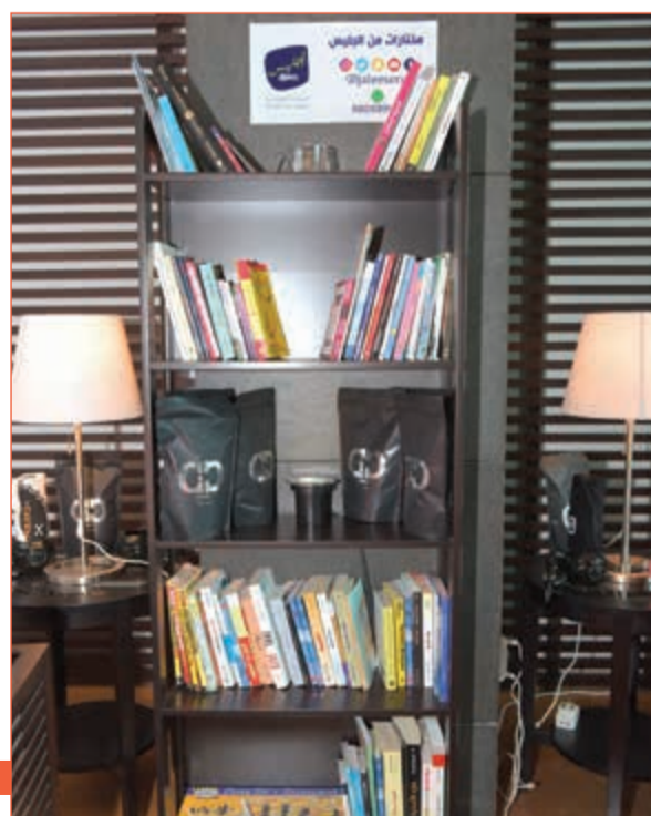
ركن الجليس في مقهى caveman