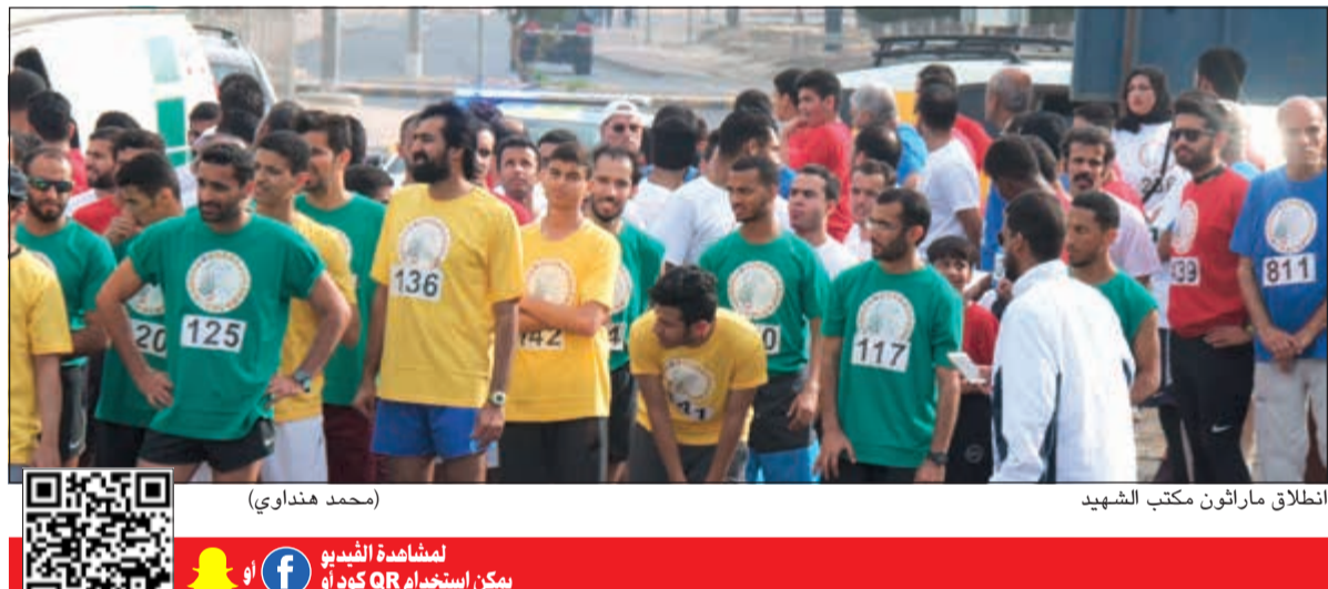
انطلاق ماراثون مكتب الشهيد