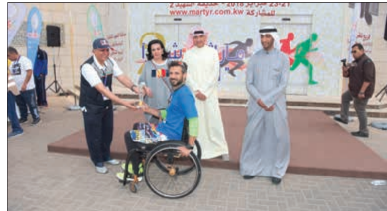
تكريم أحد الفائزين من ذوي الاحتياجات الخاصة