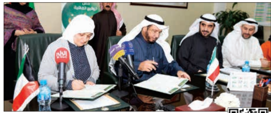
الوزيرة هند الصبيح و.عبدالله العتوق خلال توقيع الاتفاقية

ورأت الوزارة أن توقيع هذه الاتفاقية تأتي إضافة لتعزيز العمل الخيري عبر تدريب العاملين فيه سواء كانوا متطوعين أو موظفين على أساسيات العمل التطوعي في مجال الخير وكذلك على البعد الاستراتيجي والمتابعة. وأشارت إلى أن الهدف أيضا زيادة ثقة المجتمع الكويتي في الجمعيات الخيرية حتى تزداد إيراداته وتنعكس بالإيجاب على الكويت، وكل عمل يحتاج إلى