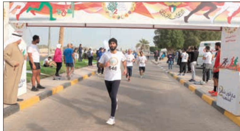
وصول أحد المتسابقين