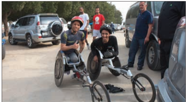
مشاركة من ذوي الاحتياجات الخاصة

وهو ضمن احتفالات المكتب بالأعياد الوطنية، لافتة إلى ان تخصيص نشاط رياضي ضمن الاحتفالات يندرج تحت مبدأ العقل السليم في الجسم السليم. وأشارت إلى مشاركة أكثر من 500 متسابق في مختلف الفئات أبرزها ذوو الاحتياجات الخاصة حيث يخصص الماراثون جانباً مهماً لهذه الفئة بالإضافة إلى فئة الرياضيين والفئات الموزعة وفق الأعمار. وتحدثت الأمير عن البرامج الخاصة باحتفال «شكر» الموجه بشكل خاص هذه السنة للجهات الحكومية التي عملت أثناء الاحتلال وكانت لها اسهاماتها في ذلك الوقت، لافتة إلى ان البرامج تبدأ يوم الأربعاء المقبل في حديقة