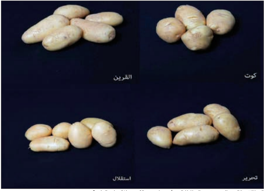
السلالات الأربع الجديدة من البطاطا التي أنتجها معهد الكويت للأبحاث العلمية

يسمح للمزارع بزراعة محصول واحد من البطاطا، إضافة إلى تحديات أخرى تتعلق بتقل الأمراض والبكتيريا والعدوى الفيروسية لبعض التقاوي المستوردة، كما هي غير متوافقة مع البيئة المحلية، مثل ملوحة التربة وكمية ونوعية المياه اللازمة للري. ومنذ سنوات طويلة عمل وما زال يعمل باحثو المعهد بجد من أجل إنتاج أفضل أنواع المنتجات الزراعية ومنها البطاطا محلياً، وذلك عن طريق تطوير تقنية زراعة الأنسجة لإنتاج سلالات البطاطا ذات جودة عالية، بالإضافة إلى استحداث أصناف مقاومة للملحة التربة ومياه الري ومقاومة الأمراض، وبهذا يكون المعهد قد حقق إنجازاً بحثياً يصب في تحسين الأمن الغذائي في الكويت.