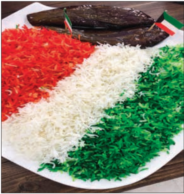
أحد الأطباق بالوان علم الكويت