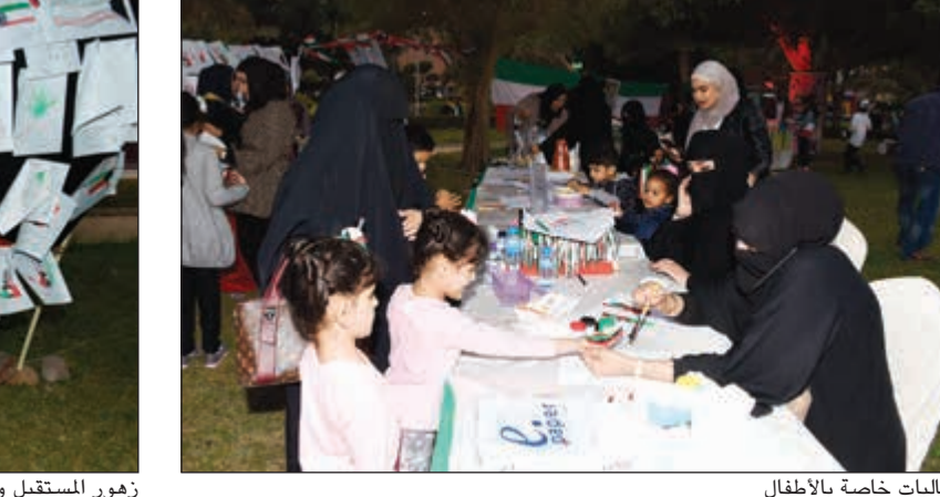
فعاليات خاصة بالأطفال