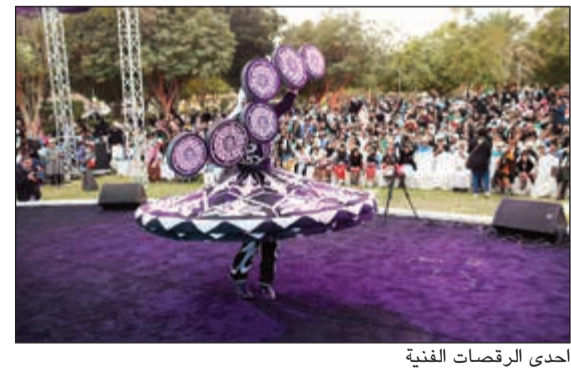
أحدى الرقصات الفنية

وسمو ولي العهد الشيخ نواف الأحمد، وسمو جابر المبارك والشعب الكويتي، داعيا الله ان يديم على الوطن الأمن والأمان والاستقرار، لافتا الى ان الاحتفالات تميزت هذا العام بسخة وطنية مميزة، مشيدا بالمشاركة الشعبية الواسعة لأهالي المحافظة وحسن التنظيم.