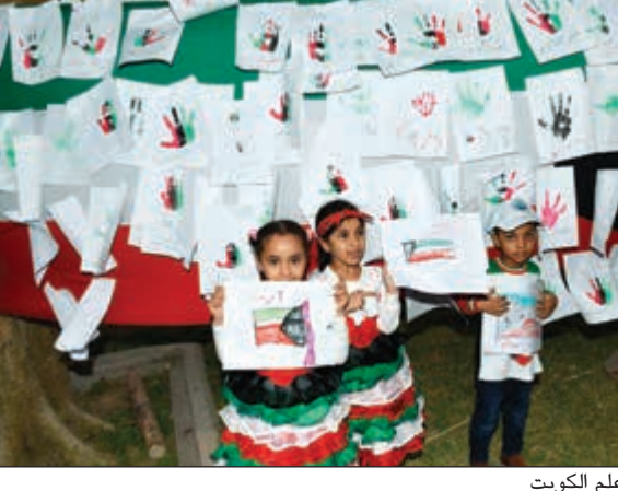
زهور المستقبل وعلم الكويت