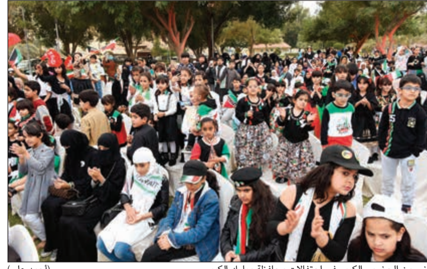
جانب من الحضور الكبير في احتفالات محافظة مبارك الكبير (احمد علي)

وسمو ولي العهد الشيخ نواف الأحمد، وسمو جابر المبارك والشعب الكويتي، داعيا الله ان يديم على الوطن الأمن والأمان والاستقرار، لافتا الى ان الاحتفالات تميزت هذا العام بسخة وطنية مميزة، مشيدا بالمشاركة الشعبية الواسعة لأهالي المحافظة وحسن التنظيم.