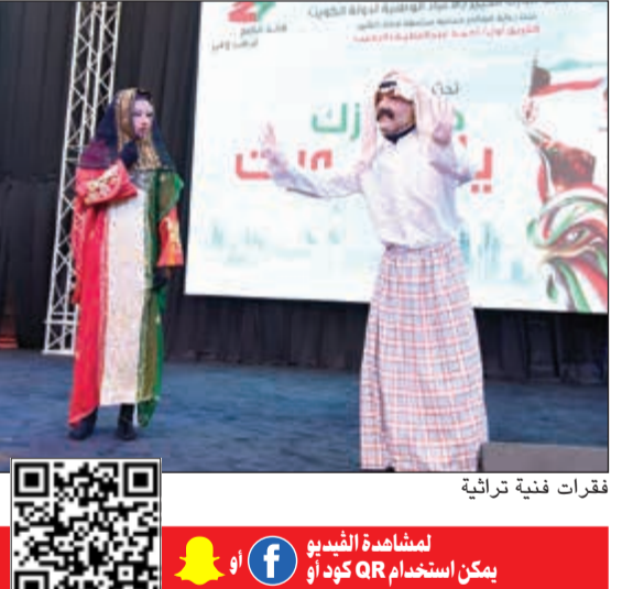
فقرات فنية تراثية