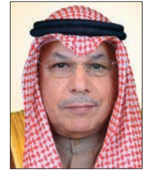
الشيخ خالد الجراح

الداعمة للشرعية. ولغت الى الدور الكويتي المميز على صعيد تجاوز الأزمة اليمنية، قائلا ان الكويت احتضنت المشاورات اليمنية لمدة اكثر من 3 اشهر، مؤكدا استعداد الكويت لاستضافة المحادثات اليمنية حتى يتم التوقيع على اتفاق نهائي. وعلى صعيد دور الكويت في دعم المجال الانساني، قال الشيخ خالد الجراح ان «الكويت اقامت عدة مؤتمرات دولية لدعم الوضع الانساني للاخوة السوريين وشاركت في مؤتمرات دوليين في لندن وبروكسل كمال تتأخر في تلبية احتياجات الوضع الانساني الكارثي الذي يعاني منه الاشقاء اليمنيون وكذلك استضافة مؤتمر لإعمار العراق الشهر الجاري إضافة الى مساهمتها الانسانية على المستوى الدولي، وتطرقت الى مسألة محاربة الارهاب، مبينا ان العناصر