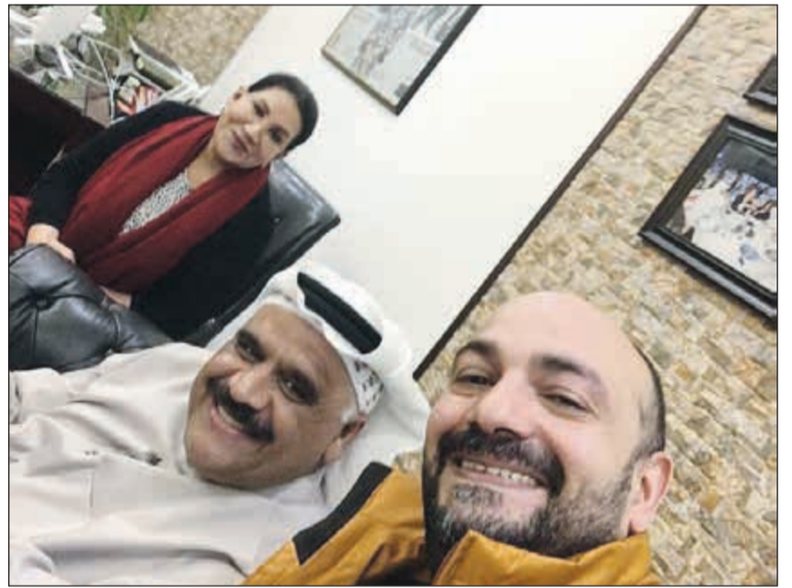
القفاص مع الفنان القدير داود حسين والفنانة القديرة سعاد عبدالله