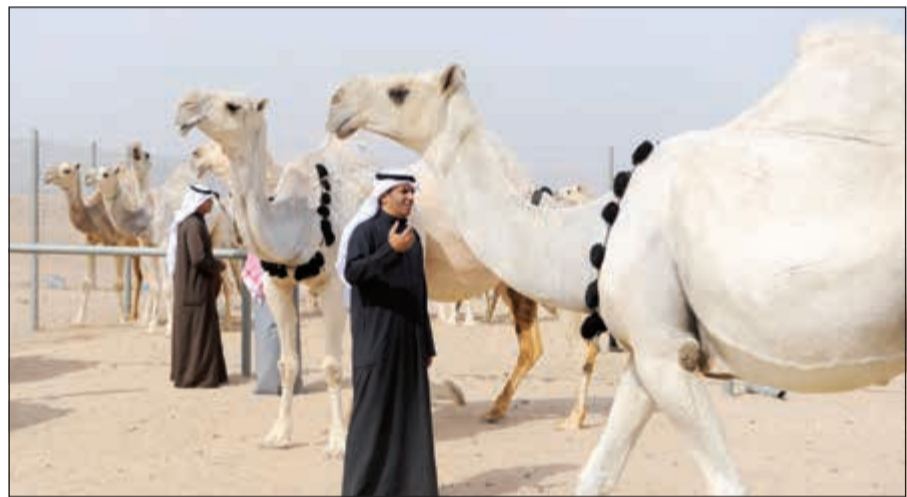
جانب من التحضيرات لمسابقات الإبل

وفي الكويت شأنها شأن دول الخليج العربي، تحظى الإبل بشعبية كبيرة بدليل ما تشهده منافسات فئة الإبل في مهرجان الموروث الشعبي الخليجي الذي يقام في قرية صباح الأحمد التراثية من إقبال كثيف والذي عرض فيه ملاك الإبل من الكويتيين والخليجيين جمال إبلهم. وعن مسابقات فئة الإبل لهذا الموسم، قال نائب رئيس اللجنة المنظمة للمهرجان ورئيس لجان التحكيم الشيخ صباح فهد صباح الناصر لـ «كونا» أمس أن مسابقات «مزاين الإبل» تتضمن أربع مسابقات لكل لون من الإبل الـ 6 وهي المجاهيم والشقح والحمر والصفح والشعل والوضح. وأضاف الشيخ صباح أن هذه المسابقات تنوعت بين المسابقات الجماعية في فئتي الـ 45 والـ 25 وكذلك فئتي الفردى للناقة أو الجمل إضافة إلى مسابقة «البعير وانتاج»، مشيرا إلى أن هذه المسابقات شهدت إقبالا واسعا من ملاك الإبل من الكويت وباقي دول مجلس التعاون الخليجي.