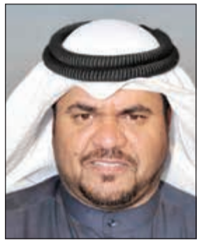
الشيخ صباح فهد الناصر

ولفت إلى أن المهرجان نظم أيضا مسابقة «هيج الإبل» التي تعبر عن سرعة الإبل وقدرتها على تحمل طبيعة الصحراء حيث يحق لكل متسابق المنافسة في 20 ناقة بحد أقصى على أن تتوج الإبل التي تصل أولا إلى خط النهاية حيث شهدت هذه المسابقة مشاركة واسعة. وأكد أن مسابقات الإبل في المهرجان أسهمت في تحسين الإنتاج في سلالاتها، موضحا أن تلك المسابقات لاسيما المزاين تحظى بشعبية كبيرة عند محبي وملاك الإبل. من جانبه، قال عضو لجنة تحكيم مسابقات المزاين مرزوق الوطري في تصريح مماثل لـ «كونا» أن مقاييس جمال الإبل تعتمد على عدة صفات، أهمها جمال الرأس وطول القامة والرقبة ونحفا إضافة إلى طول السنام وتأخره للخلف ونزوله عند منطقة الذيل. وأضاف الوطري أن جمال الناقة أو الجمل يعتمد أيضا على عرض الجنب للابل وأن تكون الأرجل والقوائم رشيقة ومتناسقة مع الذيل والشكل العام لها، مشيرا إلى أن مسابقات هذا العام «تميزت بمستوى عال ما يدل على أن الإبل في الخليج العربي وبصفة خاصة بالكويت