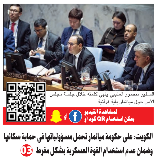
السفير منصور العتيبي يثني كلمته خلال جلسة مجلس الأمن حول ميانمار بأية قرآنية

الكويت: على حكومة ميانمار تحمل مسؤولية إلتاها في حماية سكانها وضمان عدم استخدام القوة العسكرية بشكل مفرط 03