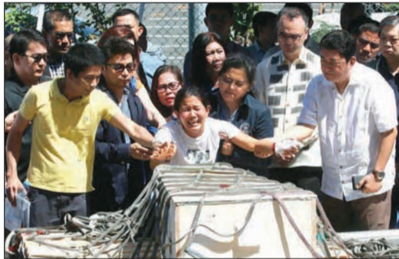
جثمان «فلبينية الغريز» وصل مانيلا

الفلبينية في الكويت بجوازات سفر عمالات المنازل الفلبينيات بالكويت، وذلك بغرض منع إساءة استخدامها من طرف أصحاب المنازل. وقال وزير الشؤون الخارجية الفلبينية الآن كايانو للصحافة: إذا ما ظل جواز السفر بحوزة العاملة الفلبينية، فإن ذلك يمثل مسؤولية عليها تجاه الحكومة الكويتية، في حالة تركها للعمل لدى صاحب المنزل، لذا فالحل الوسط هو ان تحتفظ السفارة الفلبينية باقتراح بجوازات السفر. وأضاف