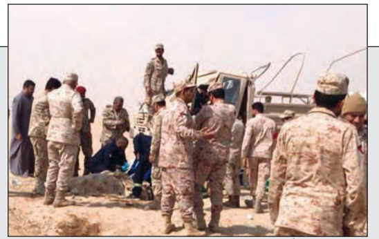
لقطة لحادث الآلية العسكرية الذي تسبب بوفاة وكيل أول