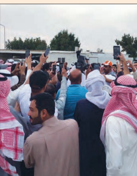
جانب من التجمع في ساحة تيماء أمس

تجمع نحو 50 شخصا من فئة غير محددية الجنسية في ساحة تيماء بعد عصر أمس الجمعة وقد انتهى التجمع بسرعة ودون مشاكل بتوجيهات وكيل وزارة الداخلية الفريق محمود الدوسري وجهود الوكيل المساعد لشؤون الأمن العام بالإنابة اللواء إبراهيم الطراح، وقد تجاوب المعتصمون مع رجال الأمن في إنهاء التجمع.