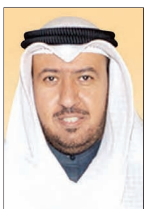
د. فهد العفاسي

وقع وزير العدل ووزير الأوقاف والشؤون الإسلامية المستشار د. فهد العفاسي ميثاق المسجد الجديد والذي يتضمن العديد من الأمور المهمة فيما يخص طبيعة عمل الإمام والخطيب والمؤذن ومدى الالتزام الوظيفي ولأئحة الجزاءات في حال الخروج عن بنود الميثاق والتي تندرج من التنبيه والإنذار والمناصحة إلى وقف مؤقت وصولاً إلى الوقف النهائي عن الخطابة والإمامة. كما يتضمن الميثاق حقوق الإمام والتزامات وزارة الأوقاف تجاهه. وأبلغت مصادر خاصة «الأنباء» بأن الوزير العفاسي وقع القرار الخميس الماضي ودخل حيز التنفيذ وسيتم تعميمه على الأئمة والخطباء وإدارات المساجد وذلك بعد سنوات من الجهود بذلتها وزارة الأوقاف في إعداد الميثاق الذي خضع لحوارات مجتمعية ونقاشات مستفيضة.