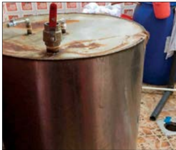
أدوات ومعدات التصنيع تم التخليط عليها