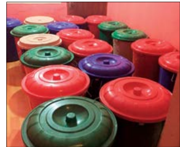
من الخمور المضبوطة داخل المصنع