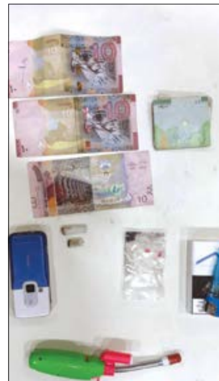
مضبوطات البدون في الجهراء