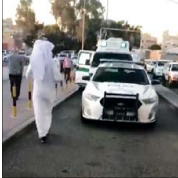
دورية الإسناد توقفت في ممر الطوارئ