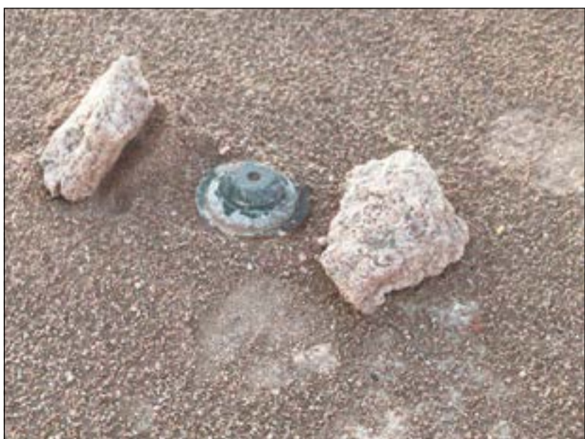
للغم قبل تفجيره من قبل إدارة المتفجرات

توجهت إحدى دوريات الأمن إلى مكان البلاغ وتمت مشاهدة الألغام وتبين أنها من مخلفات الاحتلال العراقي، وعليه تم إبلاغ الجهات المختصة (إدارة المتفجرات) والتي قامت بتنفيذ عملية تفجير هذه الألغام.