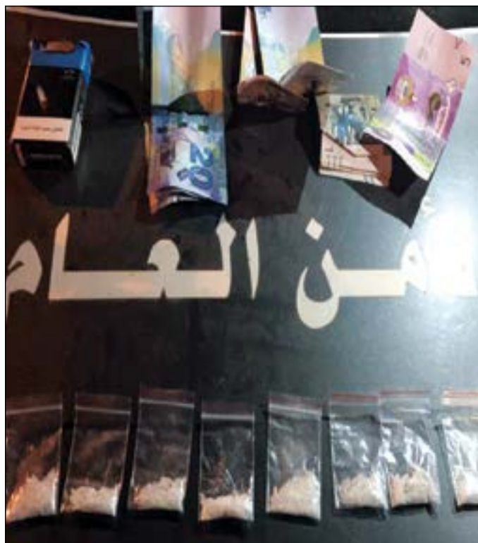
من المخدرات المضبوطة في الفروانية