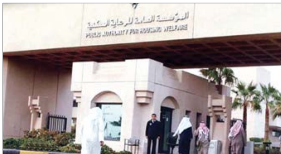
مشاريع عدة تنفذها «السكنية» لتقليص طلبات الحصول على مساكن من المواطنين

وقال بورسلي إنه مثل الجانب الكويتي في التوقيع على هذه العقود، معربا عن اعتزازه بالعمل مع الجانب العماني في هذا المشروع الحيوي الذي يجسد عمق العلاقات بين البلدين الشقيقين ويعزز التعاون الاقتصادي بين الكويت وسلطنة عمان. وأكد أن «التبترول العالمية» تضي قدمها في تنفيذ خطتها الاستراتيجية طويلة المدى 2040 قائلا: «نحن نطمح للتعاون مع شريك أجنبي أو التحالف مع إحدى الشركات النفطية العالمية في مشاريعنا وهو ما وجدناه في شراكة شركة البترول الكويتية العالمية مع شركة النفط العمانية». ولفت إلى أن التوقيع على العقود الهندسية قد تم في العاصمة العمانية مسقط، لافتا إلى أنه تمت ترسية العقد الأول والخاص بإنشاء وبناء