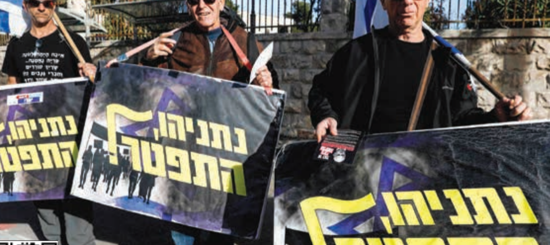
مظاهرون اسرائيليون يطالبون بتنياهو بالاستقالة

وهو منتج سينمائي في هوليوود ومواطن إسرائيلي ورجل الأعمال الاستراتيجي جيمس باكر قائلة إنهما «قدما على مدى سنوات أنواعا مختلفة من الهدايا الفاخرة» من بينها شمبانزا وسيجار وحلي لنتنياهو وأسرته. وقال البيان إن قيمة هذه الهدايا بشكل عام تجاوزت مليون شيكل (280 ألف دولار). ومن المرجح أن تركز أي إجراءات قانونية على ما إذا كان رجال الأعمال سعيًا من خلال تقديم هذه الهدايا إلى