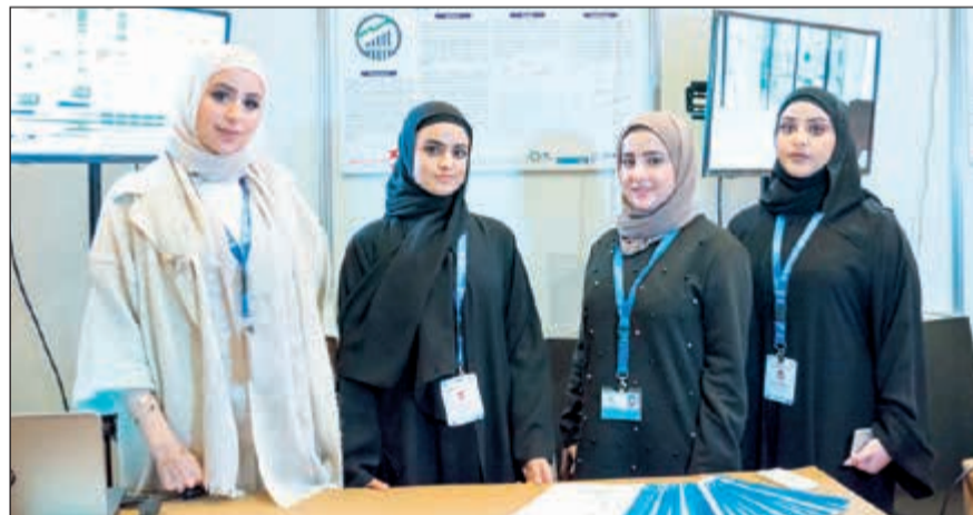
الطلبات خلال عرض مشروعين برعاية «الدولي»

حرصاً منه على دعم الأنشطة الطلابية والفعاليات الشبابية الفعالة، قدم بنك الكويت الدولي مؤخرًا رعايته لعدد من مشاريع تخرج طلبة كلية الهندسة والبتترول في جامعة الكويت، وذلك تقديراً لكونهم عصباً أساسياً في بناء مستقبل المجتمع الكويتي وتطوره.