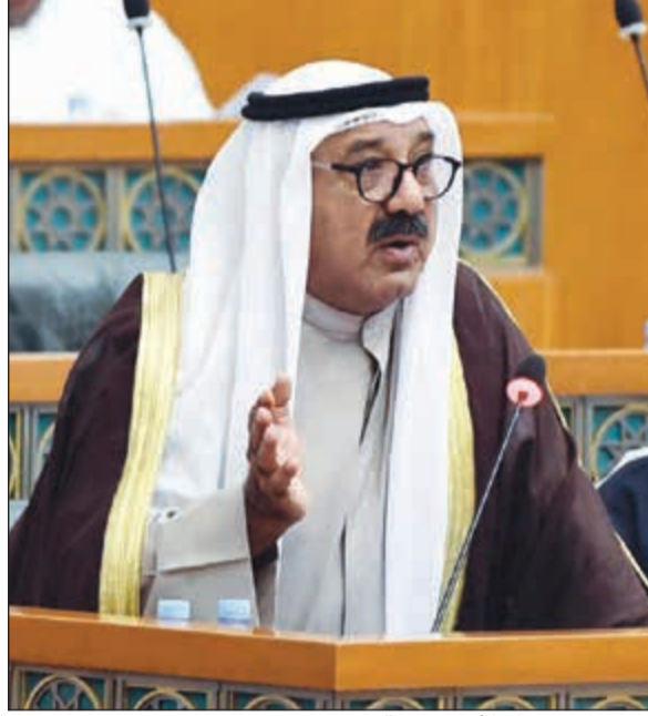
الشيخ ناصر صباح الأحمد متحدثاً