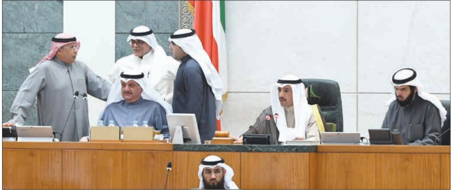
رئيس مجلس الأمة مرزوق الغانم ونائبه عيسى الكندري والشيخ خالد الجراح وصالح خورشيد وعبدالكريم الكندري ود.عادل الدمخي على المنصة (هاني الشمري)

بالرعاية والتقدير وحسن المعاملة حتى أكثر من الدول المتقدمة، كل الأشخاص الذين وقفوا ضدنا في الغزو أخذوا حقوقهم بالتراضي. أمس كان هناك اجتماع كبير لعدد كبير من الفلبينيين في السفارة الفلبينية والخادمة قالت لهم: «لا أريد السفر، الكويت أفضل من أي مكان».