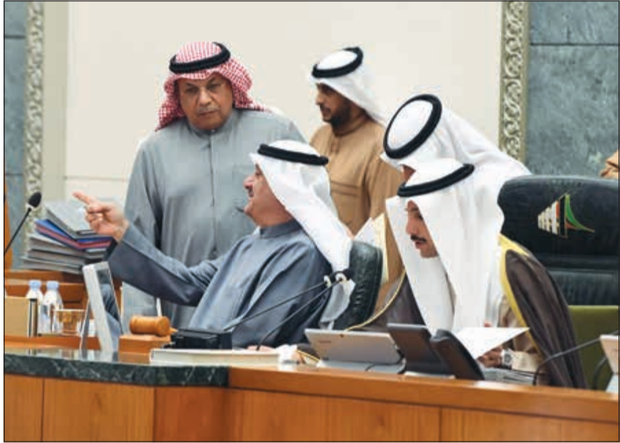
الرئيس الغانم والشيخ خالد الجراح وعيسى الكندري