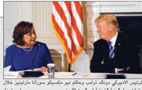
الرئيس الأميركي دونالد ترامب وحاكم نيو مكسيكو سوزانا مارتينيز خلال اجتماع حول البنية التحتية في البيت الأبيض

ثول مرة في الكويت شاهد الصفحة بتقنية الواقع المعزز حمل تطبيق Zappar