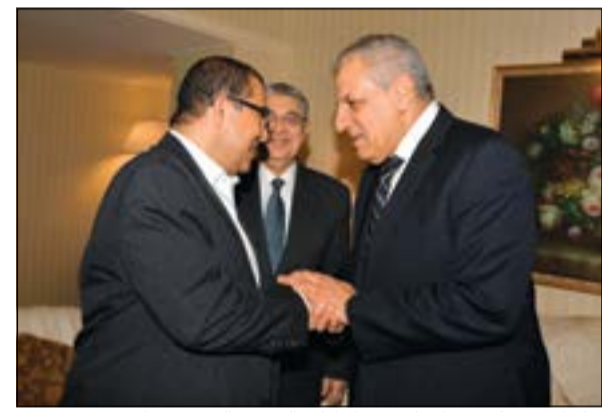
م.إبراهيم محلّب مصافحاً مستشار إدارة التحرير الزميل حسام فتحي بحضور وزير الكبرياء المصري محمد شاكر (قاسم باشا)

الإرهاب من على أرضه، لافتاً إلى أن استضافة الكويت للمؤتمر تأتي انطلاقاً من الدور الإنساني للكويت. وأكد أن مواجهة الكويت للإرهاب تخلق توازناً في المنطقة كون الإرهاب بلا حدود ويضرب العالم من كل اتجاه، مشيراً إلى أنه عندما نقضي على جيب من جيوب الإرهاب وهناك شعب دفع ثمن القضاء عليه فاقل شيء فعله هو الوقوف إلى جانبه. وأشار إلى أن الكويت تلعب دائماً أدواراً مقدرة في التمسك بالعروية وارسال رسائل إنسانية في ظل وجود شعوب تحتاج للدعم والمساندة كشعب العراق الشقيق، معرباً عن الأمل في