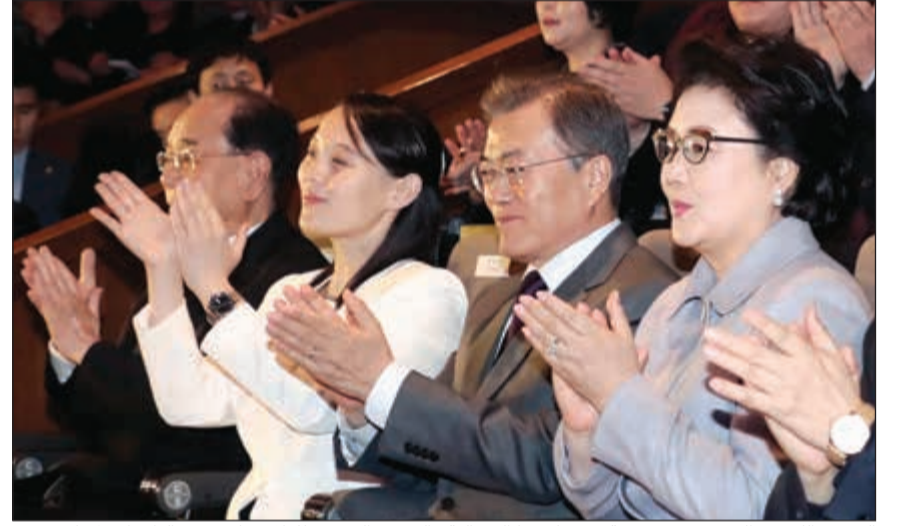
الرئيس الكوري الجنوبي مع شقيقة زعيم كوريا الشمالية والرئيس الفخري للميلاد يتابعون فعاليات الالولمبياد