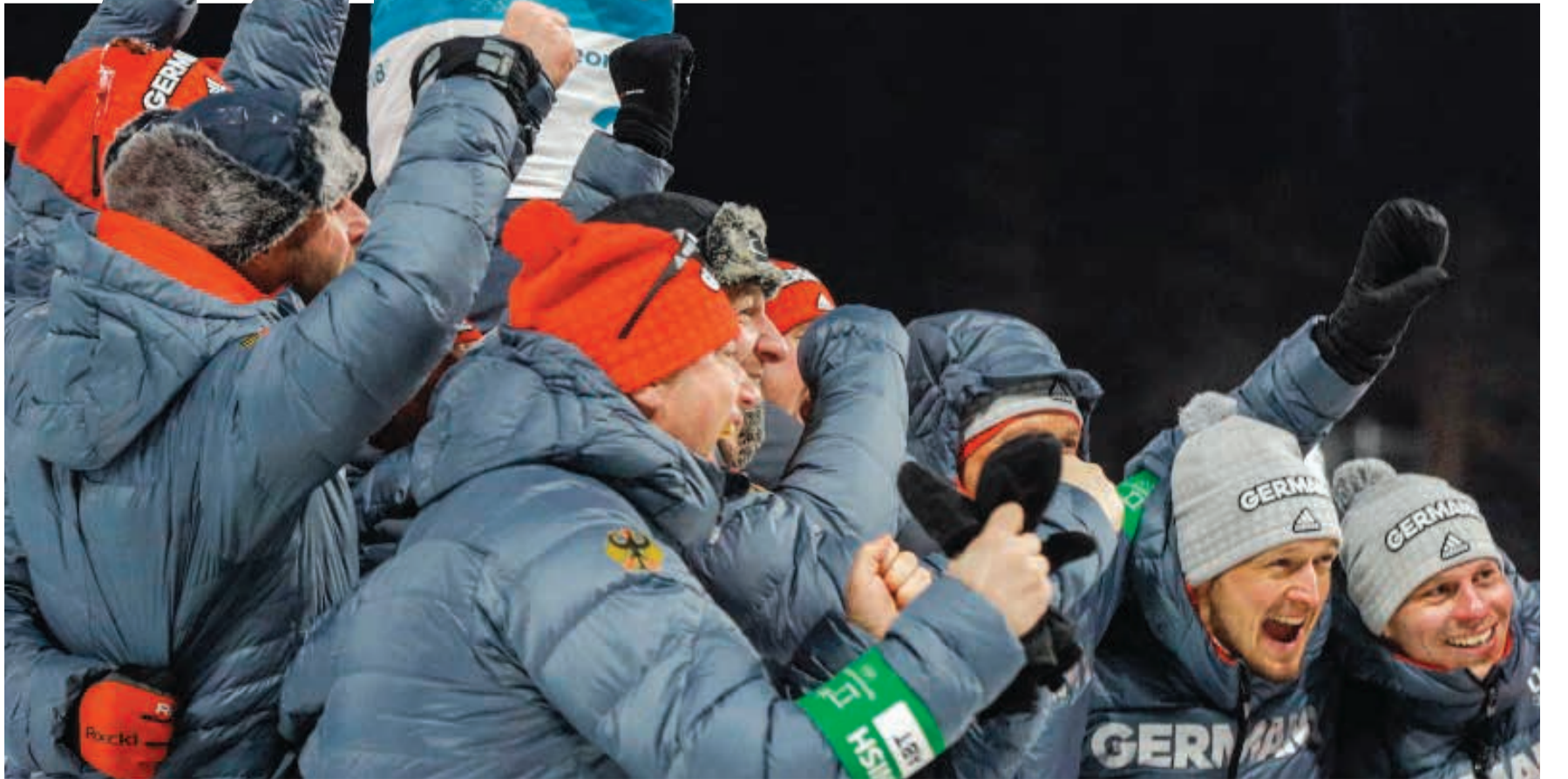
الالمانى آرند بيغر محتفلا مع زملائه بذهبية سباق السرعة (10 كلم) في منافسات البياتلون

وسبق لكوريا الشمالية ان اتهمت بالوقوف خلف العديد من الهجمات الإلكترونية عالميا خلال الأعوام الماضية، وهو ما ترفضه بشدة. أما روسيا ففتحت أي اختراقات الكترونية للألعاب الأولمبية، والتي منعت من المشاركة فيها بشكل رسمي على خلفية فضيحة التنشط المنهج برعاية الدولة، الا ان 168 رياضيا روسيا يشاركون تحت راية محايدة وبدعوة من الأولمبية الدولية، بعدما ثبتت «نظافتهم» من قضايا المنشطات.