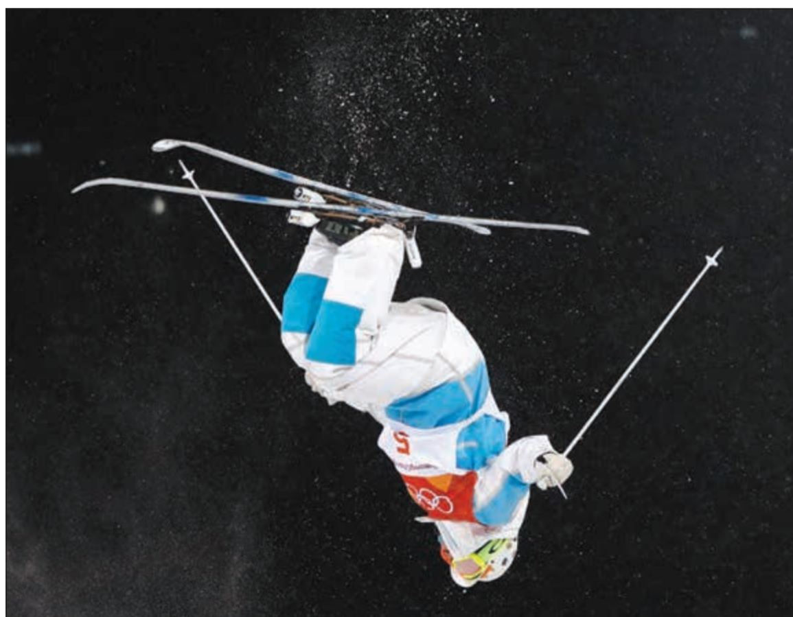
من مسابقات التزلج الحر