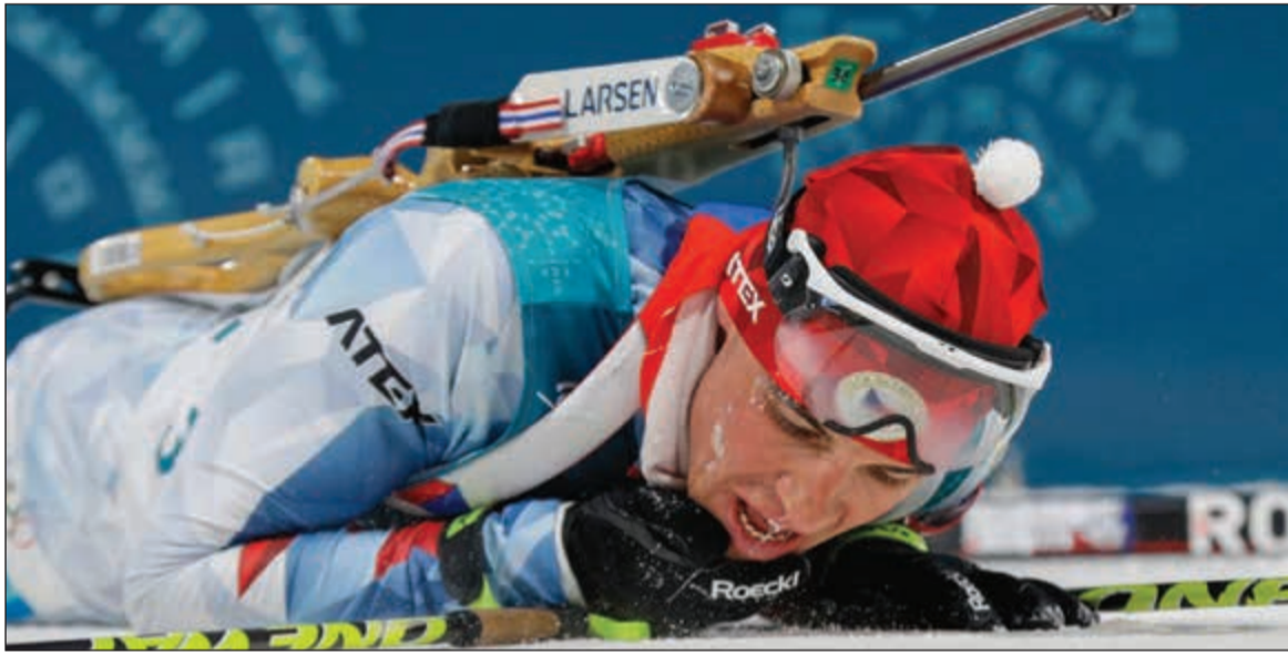
التشيكي مايكل كرومر حصد فضية البياتلون «ثانية الرماية والتزلج 10 كلم» منها بعد نهاية السباق