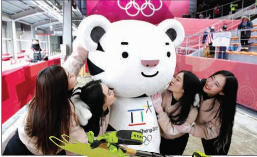
مشجعات كوريات جنوبيات مع تميمة البطولة النمر الأبيض «سوهوانغ»

وقال مدرب الفريق الأميركي للتزلج الأليبي ساشا ريريك «توقعنا الى حد ما إرجاء سباق الانحدار بسبب الرياح، لكن في الوقت نفسه كان الرياضيون مستعدين وجاهزين نظرا لأن هذه الرياضة تقام في الهواء الطلق، فهذا الأمر ليس مستغربا».