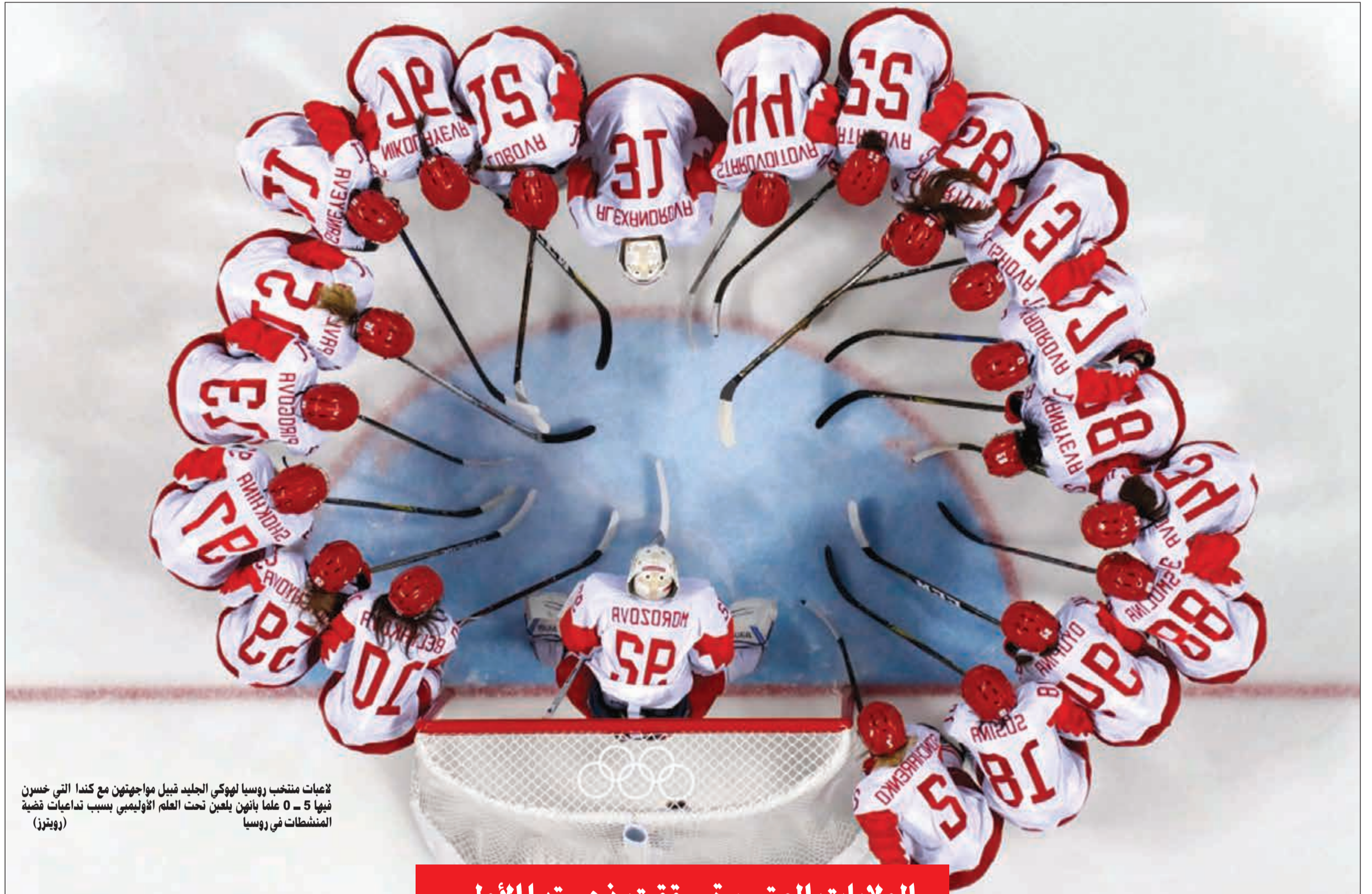
لاعبات منتخب روسيا لهوكي الجليد قبيل مواجهتهن مع كندا التي خسرن فيها 5-0 علما بانتهن يلعبن تحت العلم الأولمبي بسبب تداعيات قضية المنشطات في روسيا