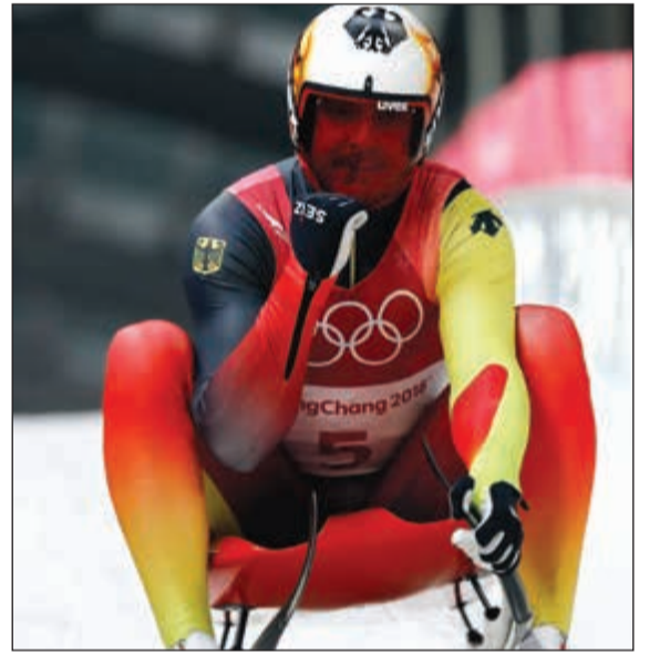
الزحاف الالمانى فليكس لوخ بعد عبوره خط النهاية