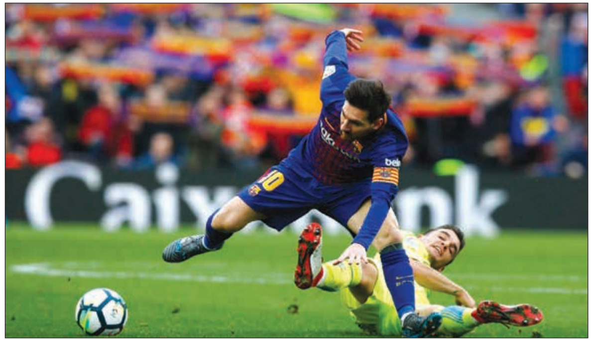
تعتبر ميسي فتعثر برشلونه

ويتحضر أتلتيكو لمواصلة مشواره القاري في «يوروبا نقطة في المركز السادس عشر. متواضع أمام توتنهام، تكرر