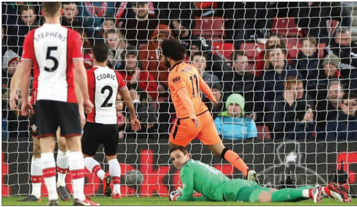
محمد صلاح يتلقى من جديد ويحافظ على وصيف الهدف