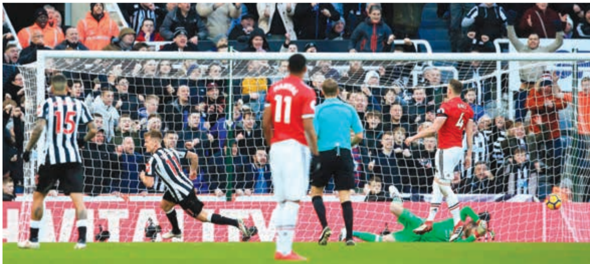
ريتش يصدق اليونانيد