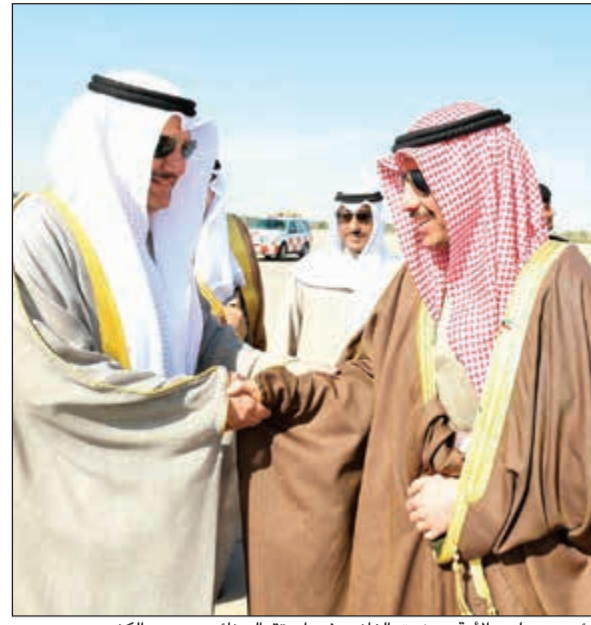
رئيس مجلس الأمة مرزوق الغانم وفي استقباله نائبه عيسى الكندري

عاد رئيس مجلس الأمة مرزوق الغانم والوفد البرلماني المرافق له إلى البلاد أمس وذلك عقب اختتام مشاركته في المؤتمر الثالث للبرلمان العربي ورؤساء المجالس والبرلمانات العربية الذي عقد في القاهرة. وكان في استقبال الغانم على أرض المطار كل من نائب رئيس مجلس الأمة عيسى الكندري ووزير الدولة لشؤون مجلس الأمة عادل الخرافي وسفير جمهورية مصر العربية لدى البلاد طارق القوني والأمين العام لمجلس الأمة علام الكندري. وضم الوفد المرافق للغانم كلاً من وكيل الشعبة البرلمانية النائب راكان النصف وأمين سر الشعبة البرلمانية النائب د. عودة الرويعي وعضو الشعبة البرلمانية النائب الحميدي السبيعي وأعضاء البرلمان العربي النواب علي الدقباسي وعسكر العززي وخالد العتيبي.