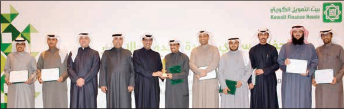
جانب من تكريم الرجال

سوف يحصل العميل على مميزات عديدة وهي التأمين ضد الغير وتسجيل المركبة مجاناً في المرور بالإضافة إلى اختيار العميل بين كفاءة أربع سنوات دون تحديد المسافة أو كفاءة خمس سنوات/ 100