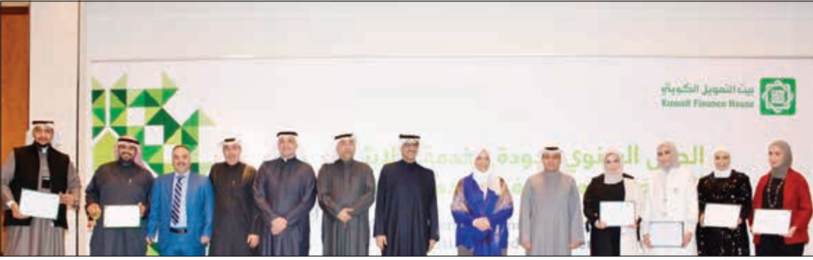
جانب من تكريم السيدات