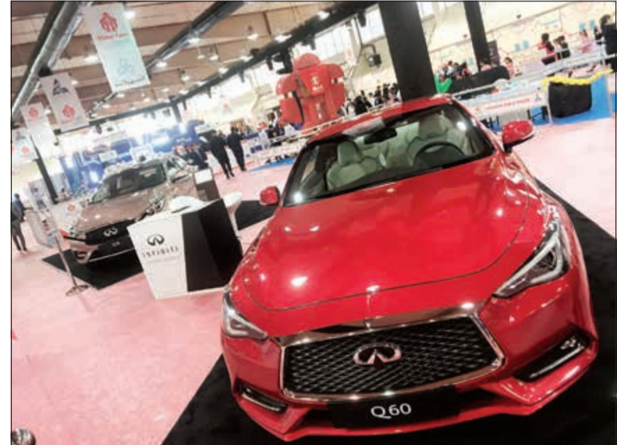
جناح «إنفينيتي الباطين» في المعرض

الدقيقة، ويوفر 350 نيوتن متر من عزم الدوران. ومع «إنفينيتي» فإن الأداء أكثر من تقديم تجربة قيادة عالية، وتضمن إنفينيتي Q60 سبورت 400 الحصول على أفضل أداء من حيث السرعة والقوة من خلال محرك توربو سعته 3 ليترات، المصمم لتوفير أداء قوي ومنظور والحفاظ على مستويات عالية من الكفاءة. كما ان عجلة القيادة أكثر أماناً وقوة مقارنة بالتصاميم السابقة، ويمكن للسائق الاختيار من بين سبعة أنماط شخصية لتوجيه السيارة وفقاً لأسلوب القيادة المفضل لديه. كما ان الحقن المباشر للبنزين، وشن الهواء المبرد بالماء، وأجهزة استشعار سرعة التوربو وتصميم شفرة التوربينات المتقدمة، تجعل الأوتو أسرع وتوفر نزوة أعلى للقيادة على جميع الطرقات.