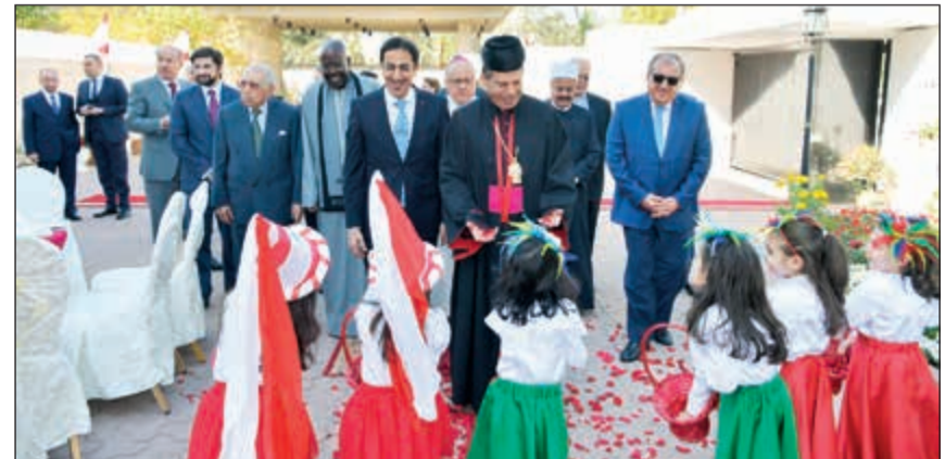
مطلقات يقدمون الورد للمطران ادغار ماضي في حضور ماهر خير وعدد من المشاركين في الاحتفال

شدد المطران اللبناني ادغار ماضي، على أهمية العلاقات التي تربط لبنان بالكويت واصفا إياها «بالعميقة والثيقة والتاريخية». واعررب على هامش حفل الغداء الذي نظّمته السفارة اللبنانية على شرفه بمناسبة زيارته إلى البلاد، للمشاركة الجالية المارونية احتفالاتها بعيد مار مارون، اعراب عن سعادته بزيارته إلى الكويت، مشيراً إلى أنها بلد «محبة وخير وسلام».