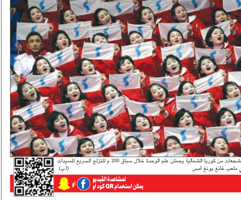
مشجعات من كوريا الشمالية يحملن علم الوحدة خلال سباق 200 متر للتزلج السريع للسيدات في ملعب غانغ بيونغ أمس (أ.ب)

عواصم - وكالات: طغت السياسة على اليوم الثاني من دورة الألعاب الأولمبية الشتوية في بيونغ تشانغ، بعد الدعوة التي وجهها زعيم كوريا الشمالية كيم جونج أون لرئيس كوريا الجنوبية مون جاي-إن لعقد قمة في بيونغ يانغ، لكن واشنطن بدت مستاءة، حيث حذرت من التقارب. ونقلت الدعوة كيم يو جونج شقيقة الزعيم الكوري الشمالي التي تترأس بعثة بلاده التي حضرت مادية غداً أقامها الرئيس الجنوبي المؤيد للحوار مع الشمال. من جهتها، أشادت اللجنة الأولمبية الدولية بالمصافحة «التاريخية» بين «جاي - إن» و«يو-جونغ»، خلال حفل الافتتاح أول من أمس. معتبرة أنها «كانت لحظة تاريخية من وجهة نظر الجميع». التفاصيل ص 37