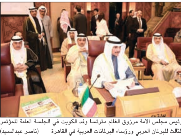
رئيس مجلس الأمة مرزوق الغانم مترشفاً وفد الكويت في الجلسة العامة للمؤتمر الثالث للبرلمان العربي ورؤساء البرلمانات العربية في القاهرة

أكد رئيس مجلس الأمة مرزوق الغانم على أهمية التنسيق بين البرلمانات العربية لنصرة قضاياها في المحافل الإقليمية والدولية خاصة أن نقاشي ظاهرة الإرهاب بات يهدد الدول والمجتمعات العربية. جاء ذلك في تصريح عقب اختتام أعمال المؤتمر الثالث للبرلمان العربي ورؤساء المجالس والبرلمانات العربية الذي عقد في القاهرة، حيث تم اتفاق بالإجماع على وثيقة عربية شاملة لمكافحة الإرهاب والفكر المتطرف سترفع الى مجلس جامعة الدول العربية الـ 29 على مستوى القمة والذي سيعقد في المملكة العربية السعودية في شهر مارس المقبل. وتطرق الغانم إلى الاجتماع المغلق الذي حضره رؤساء البرلمانات العربية قائلاً: ان الاجتماع شهد اتفاقاً على تقديم البند الطارئ الإضافي في مؤتمر الاتحاد البرلماني الدولي المقبل بعنوان «أحقية الفلسطينيين بالقدس» والرجوع الى الميثاق الدولي وقرارات منظمة الأمم المتحدة بهذا الشأن ليكون متماشياً مع الدعوات العالمية وليست فقط العربية والإسلامية تجاه إدانة اعتبار القدس عاصمة للمكان الصهيوني المغتصب. التفاصيل ص 9