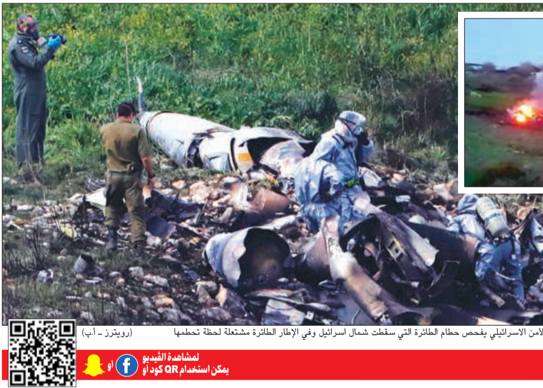
الأمن الإسرائيلي يفحص حطام الطائرة التي سقطت شمال إسرائيل وفي الإطار الطائرة مشتعلة لحظة تحطمها

فقد أعربت عن عدم رغبتها في التصعيد لكنها اتهمت إيران والنظام بـ«اللعب بالنار» وتعدت بتدفيعهما «ثمنا باهظا». واللائت أن ردود الفعل الدولية على تطور مثل هذا قد يشعل المنطقة، جاءت حذرة، إذ دعت موسكو جميع الأطراف لضبط النفس، فيما اشتكى لبنان إسرائيل لدى الأمم المتحدة لاستخدامها أجواءه في تنفيذ الغارات واعرب عن تأييده للنظام. التفاصيل ص 32-33