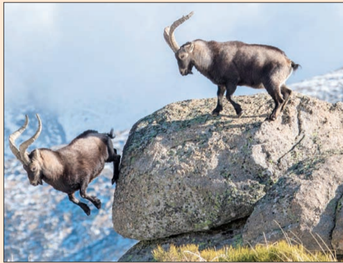
سقوط الخاسر إلى الهاوية