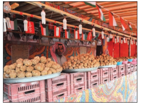
ندرة الفقع الكويتي رفعت أسعار المستورد في الأسواق (زين علام)

غياب الفقع يضع البيئة البرية تحت المجهر.. وأسعار نار