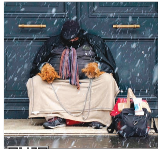
مشرد تحت الجليد المتساقط مع كلبه في شارع هاوسمان في باريس

باريس تخشى على المشردين وتبقي «إيفل» مغلقاً بسبب الثلوج