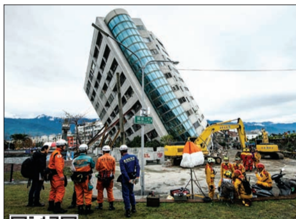
عمال إنقاذ تايوانيون ويابانيون يطالعون المبنى المائل

استمرار البحث عن ناجين في مبنى تايوان المائل